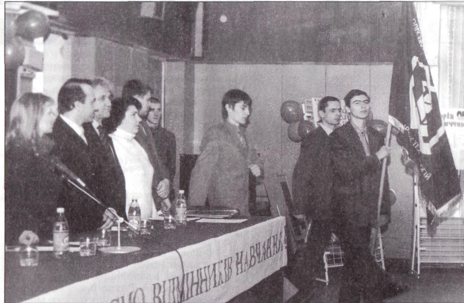
На снимке: торжественное открытие слета отличников академии.

Проведено цілий ряд науково-практичних семінарів в рамках діяльності Інституту післядипломної освіти і підвищення кваліфікації працівників харчової і зернопереробної промисловості.