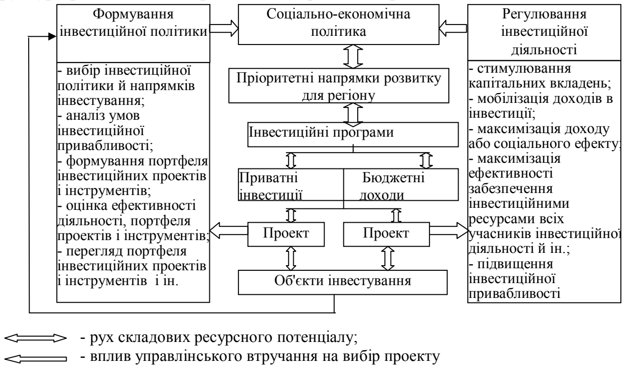
Рис.1. Структура регіонального інвестиційного управління

інвестиційними процесами в регіоні на основі головних напрямків регіонального розвитку у формі багаторівневої схеми забезпечення цілей і завдань проектного управління на місцевому рівні, яка розкриває основні напрями впровадження програми й критерії організації та діяльності структури регіонального проектного управління (рис.1).