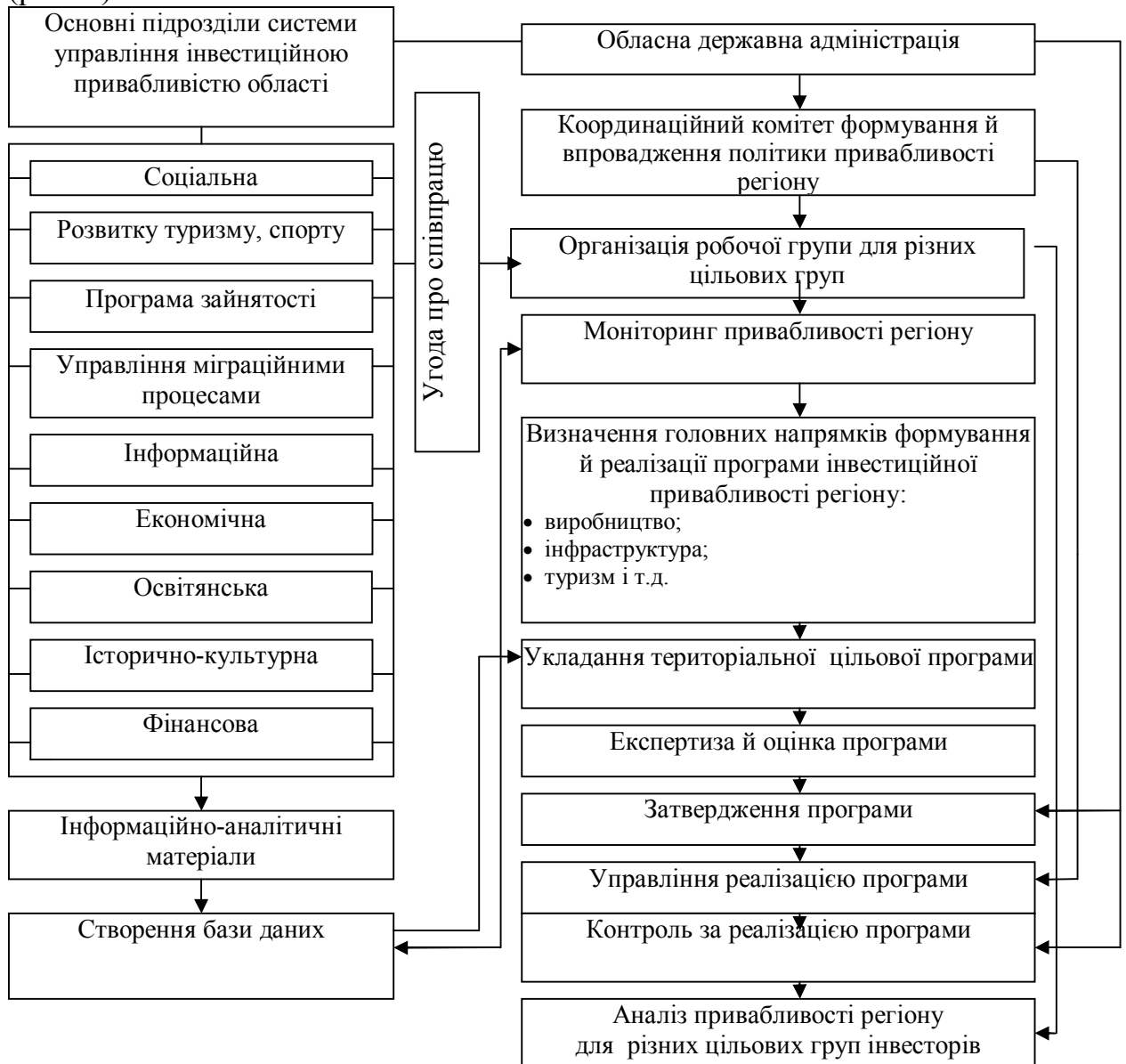
Рис. 4. Організаційно-функціональний механізм розробки і впровадження політики інвестиційної привабливості Миколаївської області

Описаний організаційно-функціональний механізм організації і впровадження політики формування позитивного інвестиційного іміджу Миколаївської області створено на основі взаємодії системних, процесних, програмно-цільових чинників, головними показниками серед яких є: виокремлення головних підрозділів управління інвестиційною привабливістю території; виділення головних напрямків програми привабливості області; створення новітнього інформаційного забезпечення організації й реалізації програми; розробка територіальної цільової концепції. (рис. 4).