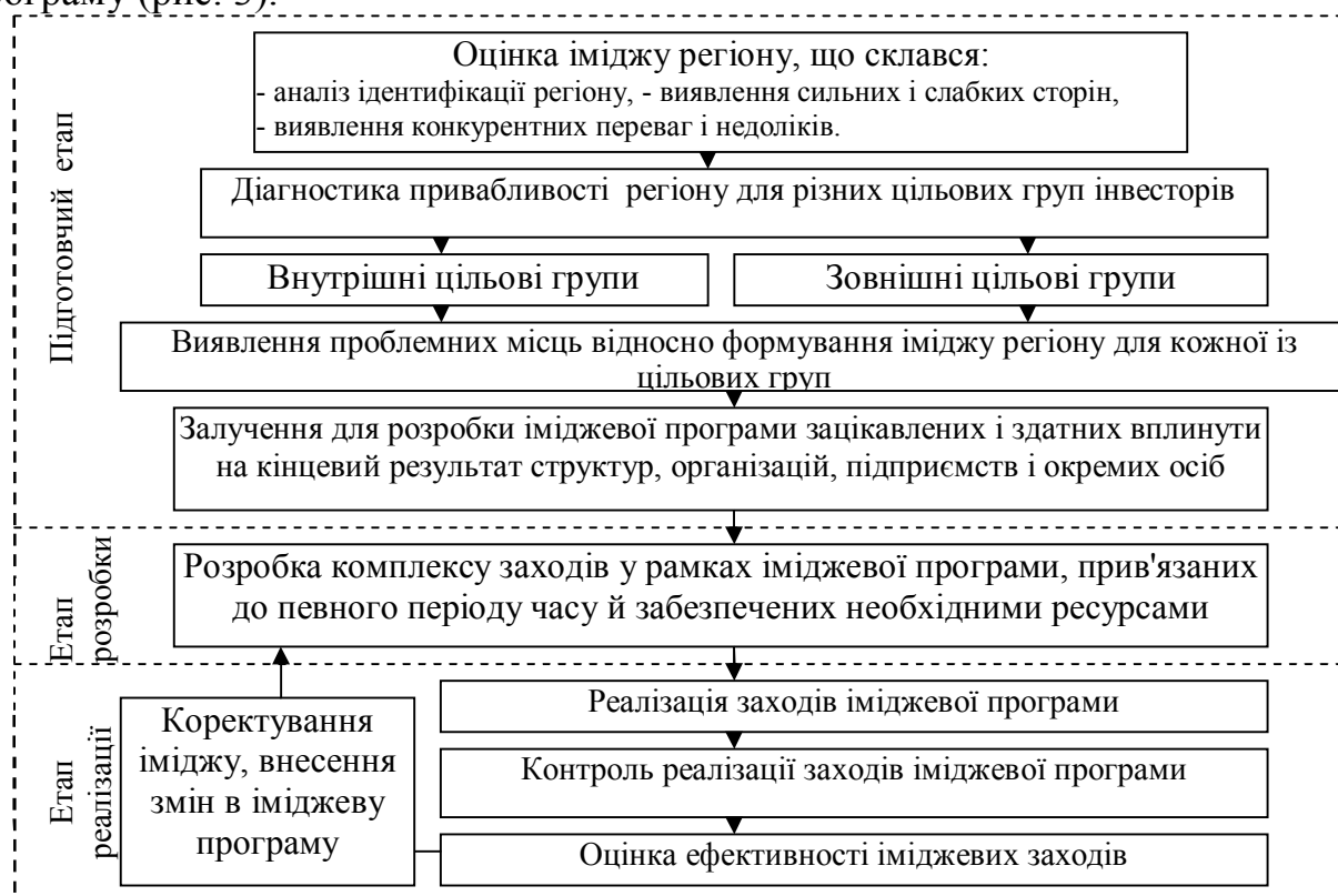
Рис. 3. Структурно-логічна схема процесу формування іміджу регіону

Розроблена структурно-логічна схема процесу формування позитивного іміджу регіону, що враховує особливості кожної з цільових груп інвесторів, особливістю якої є орієнтація всього процесу формування позитивного іміджу регіону на урахування і задоволення інтересів представників цільових груп інвесторів. Важливим аспектом є наявність можливості коректування іміджу, внесення змін в іміджеву програму (рис. 3).