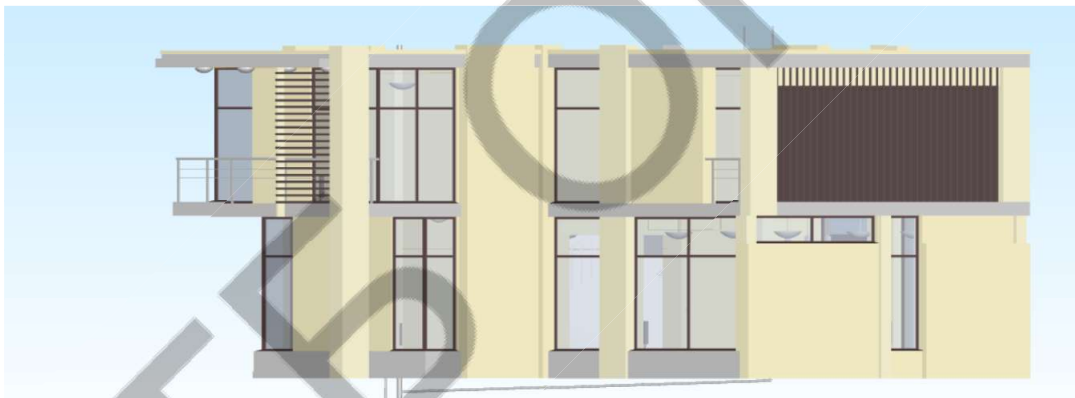
Рисунок 3 – Приклад візуалізації в C3D Vision (онлайн-версія)

Наявні API для інтеграції з клієнтськими програмами.