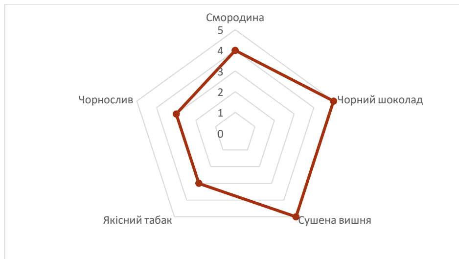
Рис. 7. Профілограма ароматичного профілю білого напів-десертного вина Каберне Совіньон

Зовсім інша картинка була виявлена в результаті порівняльного аналізу червоних вин.