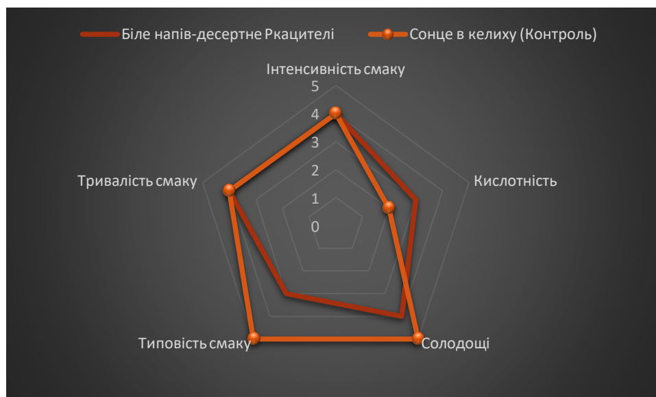
Рис. 5. Порівняні профілограми смаку білих солодких вин десертного типу

У смаку напів-десертного Ркацителі відзначалася тенденція до деякого підвищення кислотності, біло відзначено токайський напрямок смаку, але мало місце деяке зниження солодощі та загальної типовості десертного вина.