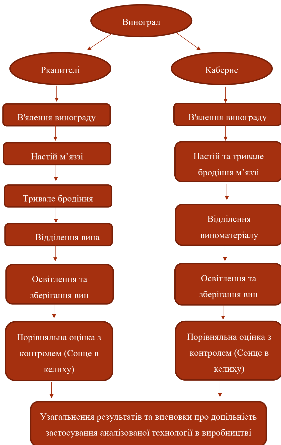
Рис. 1 – Технологічні схеми приготування опитних зразків вин