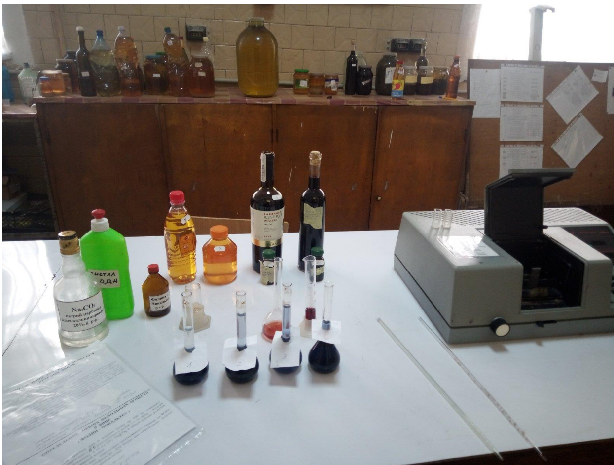
Рис. 3. Визначення масової концентрації суми фенольних речовин та оптичних характеристик

Далі був проведений аналіз ряду додаткових показників – масова концентрація фенольних речовин та оптичні показники (рис. 3).