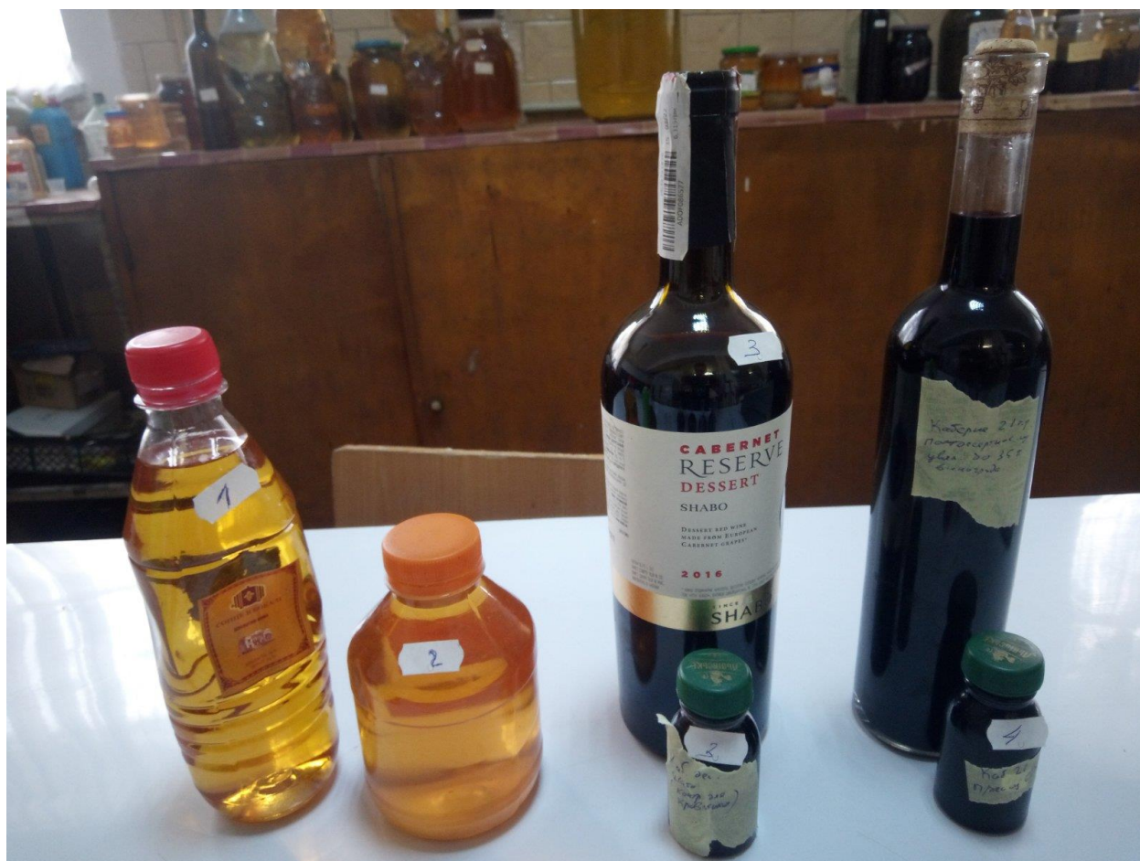
Рис.2 Опитні та контрольні зразки вин

Виробництво червоного напів-десертного вина здійснювалось за аналогічною технологією за тою різницею, що настій мезги проводився 2,5 місяця. Після цього червона мезга також прямувала на пресування, виноматеріали подавалися на освітлення, зберігання, та проведення досліджень.