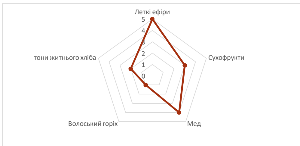
Рис. 4 Профілограма ароматичного профілю білого напів-десертного вина Ркацителі

При цьому інтенсивність аромату в дослідному зразку була досить високою, але на тлі цікавих токайських та сухофруктових відтінків з'являлися нав'язливі ефірні тони. (рис. 4).