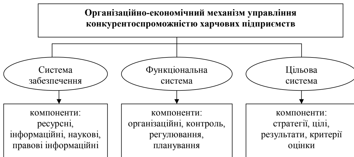
Рис. 3. Структура організаційно-економічного механізму управління конкурентоспроможністю підприємств харчової промисловості

компонентів, а саме: суб'єкти та об'єкти управління; послідовність етапів впровадження та використання стратегічного управління ресурсним потенціалом харчового підприємства у цілому; завдання стратегічного управління ресурсним потенціалом; оцінка ресурсного потенціалу: послідовність, результати та наслідки; розробка заходів забезпечення розвитку ресурсного потенціалу; аналіз меж інтегрального показника ресурсного потенціалу; коригувальні дії у разі часткової відповідності ресурсного потенціалу вимогам харчового підприємства; розробка рекомендацій щодо підвищення ефективності використання ресурсного потенціалу.