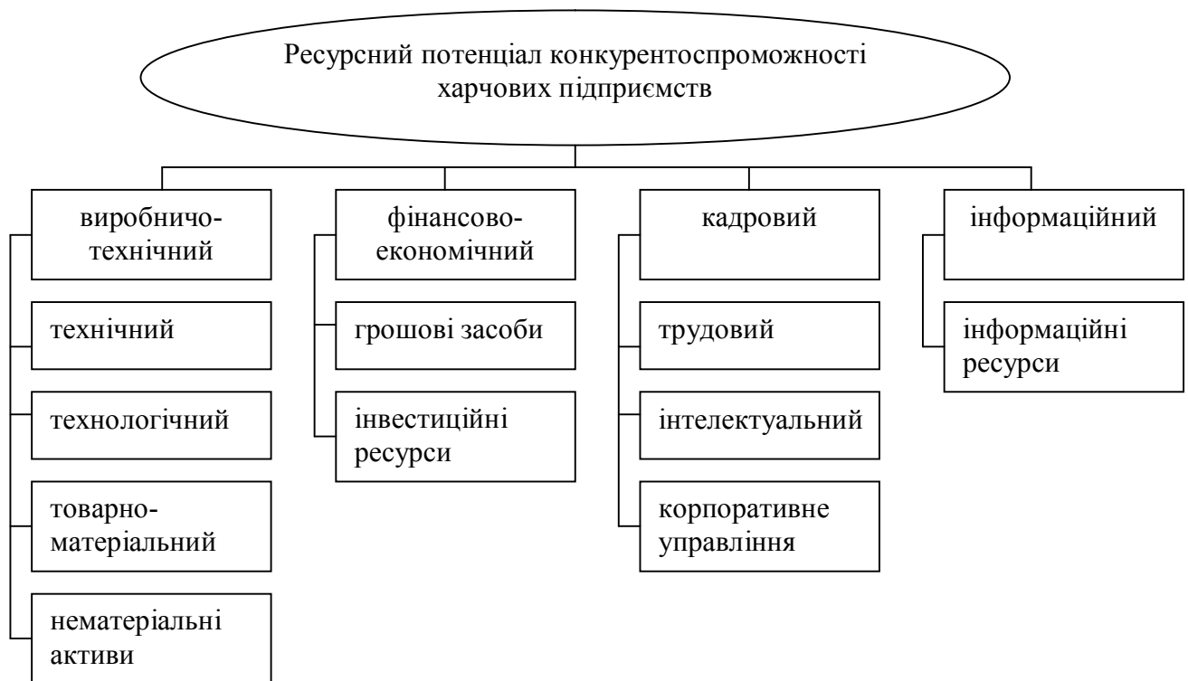
Рис. 1. Структура ресурсного потенціалу конкурентоспроможності харчових підприємств

Доведено, що ресурсний потенціал конкурентоспроможності харчових підприємств формують власне їх сировинні, матеріально-технічні, трудові, фінансово-економічні, інноваційно-інвестиційні, інформаційні ресурси, а також фінансово-економічна стійкість та якість і споживчі властивості готової продукції у сприятливому порівнянні з її собівартістю та ціною (рис. 1). Таке розуміння деталізує структуру ресурсного потенціалу конкурентоспроможності відносно його загального визначення та ідентифікує місце у системі категорій конкурентоспроможності харчових підприємств. Окремо слід наголосити на необхідність включення у склад інформаційних ресурсів, крім оргтехніки, комп'ютерних мереж, різних баз даних, рекламної продукції та діяльності.