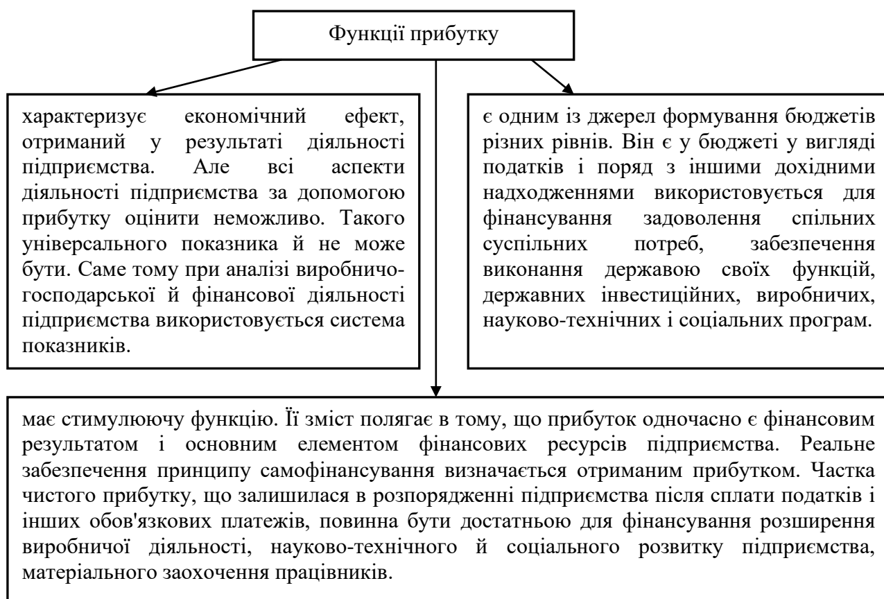
Рисунок 1.1. Функції прибутку

Прибуток як найважливіша категорія ринкових відносин виконує наступні основні функції (рисунок 1.1).