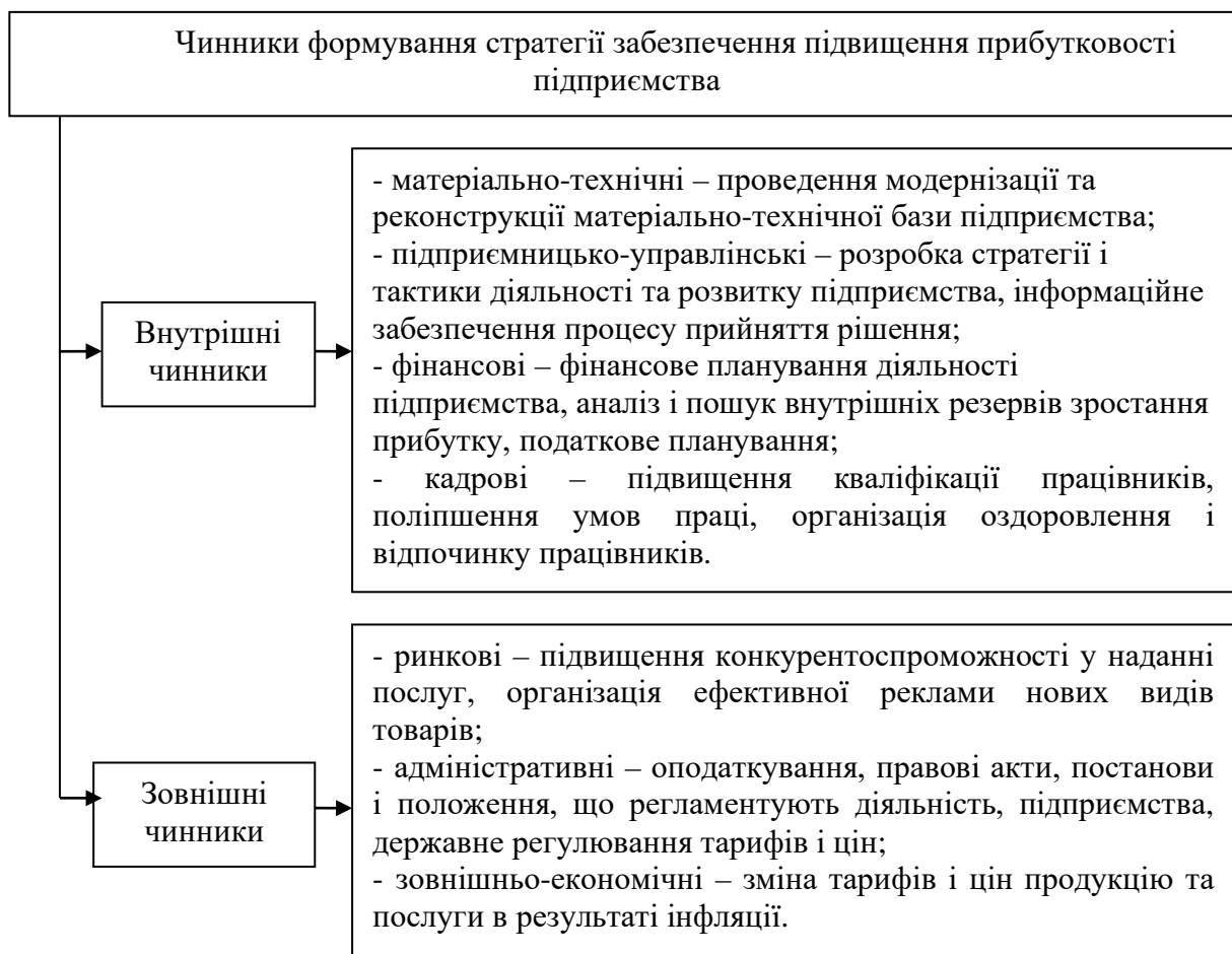
Рисунок 1.3. Чинники формування стратегії забезпечення підвищення прибутковості підприємства

Фактори внутрішнього середовища можна розділити на виробничі, що безпосередньо пов'язані з основною діяльністю підприємства, і позавиробничі, фактори, що безпосередньо не пов'язані з виробництвом продукції і з основною діяльністю підприємства.