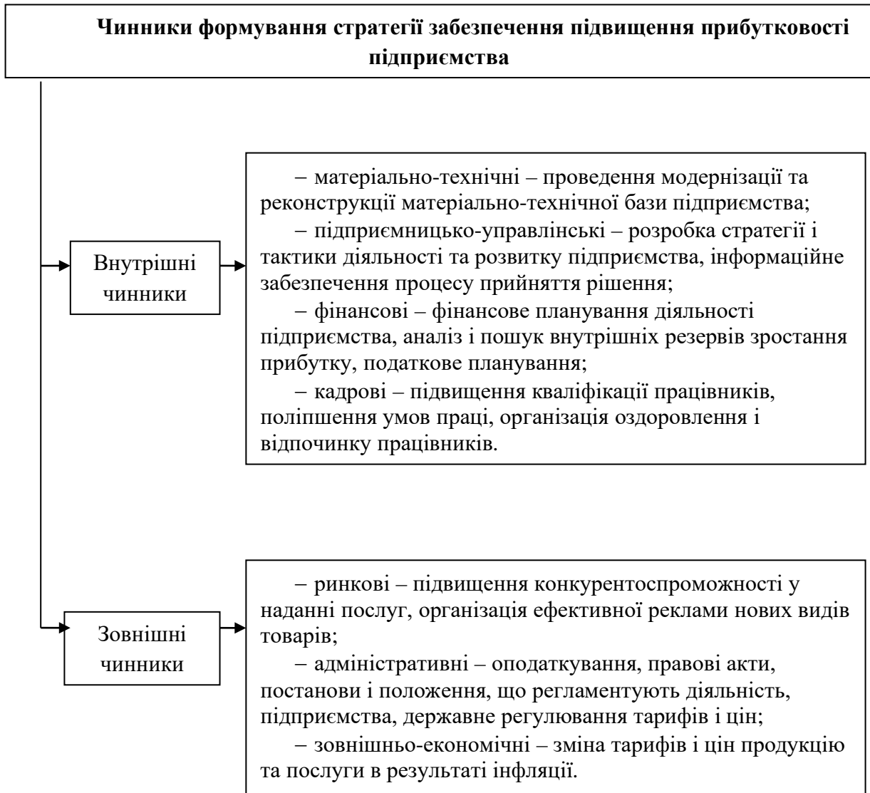
Рисунок 3. Чинники формування стратегії забезпечення підвищення прибутковості підприємства