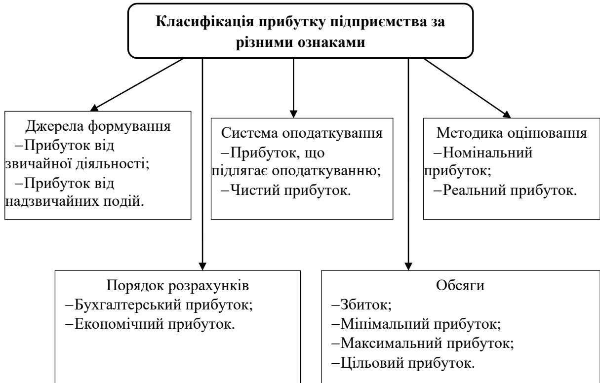
Рисунок 2. Основні види прибутку підприємства