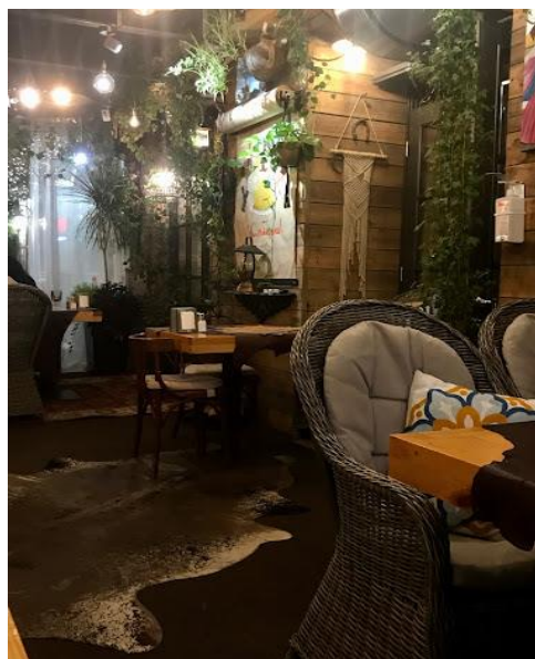
Рис. 1.1 Інтер'єр ресторану «Пироги та м'ясо»

Інтер'єр закладу має особливий характер, який підкреслює атмосферу затишку та смаку. Увага приділяється використанню природних матеріалів та традиційних елементів, що характерні для кавказької культури. Значну увагу приділяється дереву, яке використовується для меблів, підлоги та інших деталей. Це надає ресторану теплоти та природної естетики. Також заклад прикрашає велика кількість зелені. У декорі використовуються елементи, які нагадують про культуру та традиції Кавказу. А саме картини, вироби з кераміки або килими. Вони додають унікального шарму та глибини дизайну, розкриваючи гостям атмосферу традицій та гостинності.