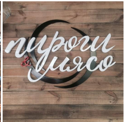
Рис 2.8 Вивіска на вході ресторану