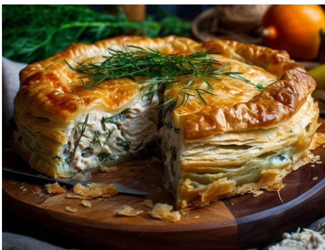
Рис. 2.2 Київський пиріг з куркою та зеленню

В ресторані «Пироги та м'ясо» також є страву Київської області. А саме усім відома котлета по-київськи. Цю страву можна скуштувати у вигляді пирога з куркою та зеленню.