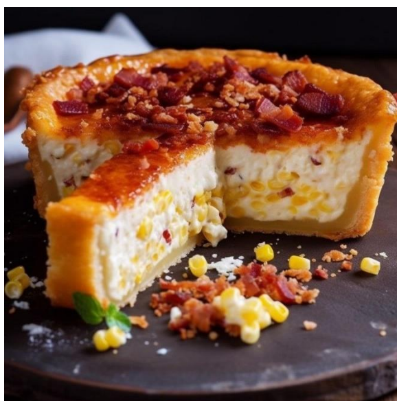
Рис. 2.1 Закарпатський пиріг з кукурудзяного борошна

шкварками. За допомогою штучного інтелекту можливо відобразити ідею цієї концепції та вигляд майбутньої страви.