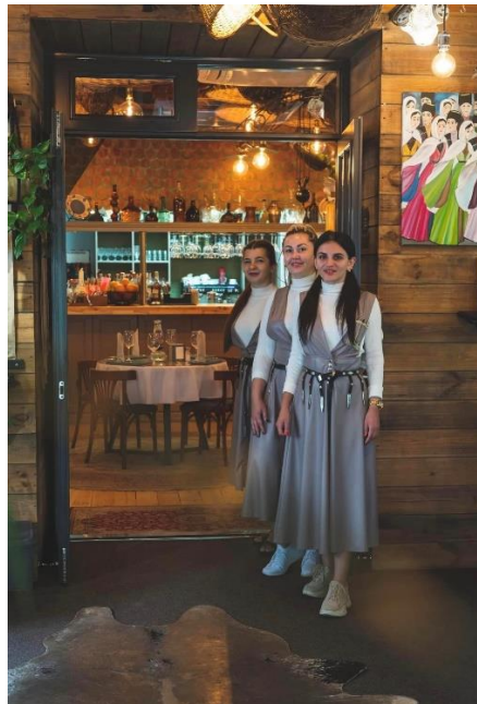
Рис. 2.10 Уніформа офіціантів ресторану «Пироги та м'ясо»

Усі офіціанти ресторану одягнені в однакову уніформу, що створює враження організованості та професіоналізму. Вони носять білу водолазку та довгу світло-сірого кольору юбку, що надає їм офіційний та дбайливий вигляд.