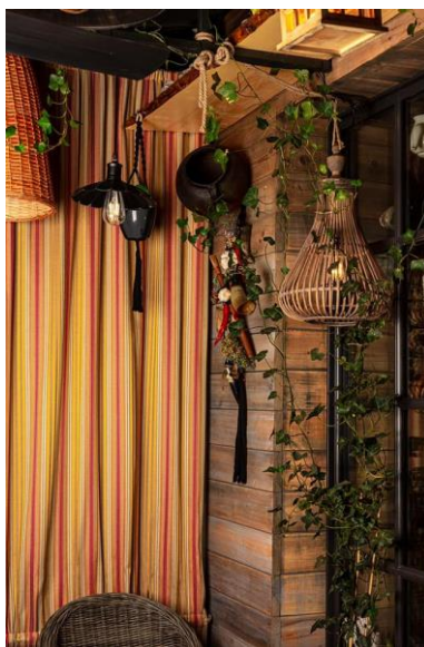
Рис. 2.7 Елементи декору ресторану «Пироги та м'ясо»

Одним з основних елементів інтер'єру "Пироги та м'ясо" є використання дерев'яного матеріалу. Всередині ресторану ви зустрінете дерев'яні меблі, підлогу, столи, стільці, двері та полички. Дерев'яні елементи додають природності та тепла всьому простору, створюючи неповторну атмосферу затишку та комфорту. Особливістю інтер'єру є світильники з плетеними абажурами, які розташовані по всьому ресторану. Ці світильники доповнюють інтер'єр ресторану домашньою атмосферою та надають приміщенню теплого світла. Окрім того, у ресторані "Пироги та м'ясо" можна побачити багато зелених акцентів, які чудово поєднуються з дерев'яними елементами. Рослини та декоративні зелені акценти створюють свіжість та гармонію в приміщенні, а також додають особливого шарму і живості інтер'єру. Також, ресторан "Пироги та м'ясо" прикрашається традиційними кавказькими елементами декору. Тут можна побачити картини, килими, глечики та інші речі, які підкреслюють культурний контекст Кавказу та створюють атмосферу автентичності.