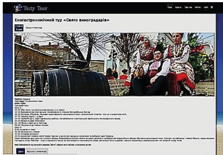
Рис.2 Еногастрономічний тур «Свято виноградарів»

Неодмінною складовою туристичного сайту є пошук потрібного туру. Користувач задає необхідні параметри туру, все інше за нього робить комп'ютер. На Рис.2 показаний приклад Еногастрономічного туру «Свято виноградарів».