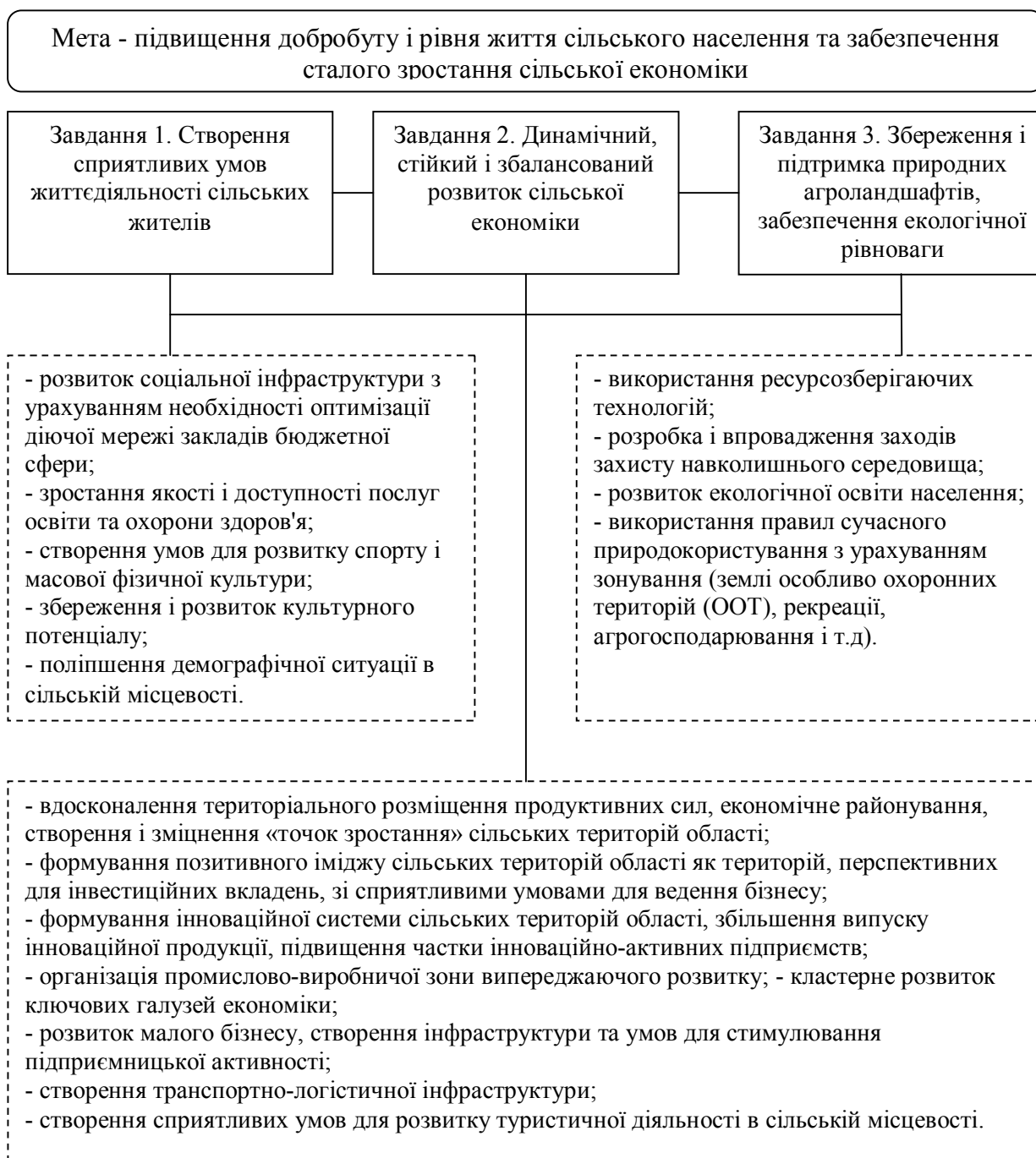
Рис. 3. Дерево цілей і завдань регіональної політики стійкого сільського розвитку

При визначенні системи заходів і заходів політики стійкого сільського розвитку необхідно враховувати інтереси всіх груп інтересів, яких безліч (рис. 4).