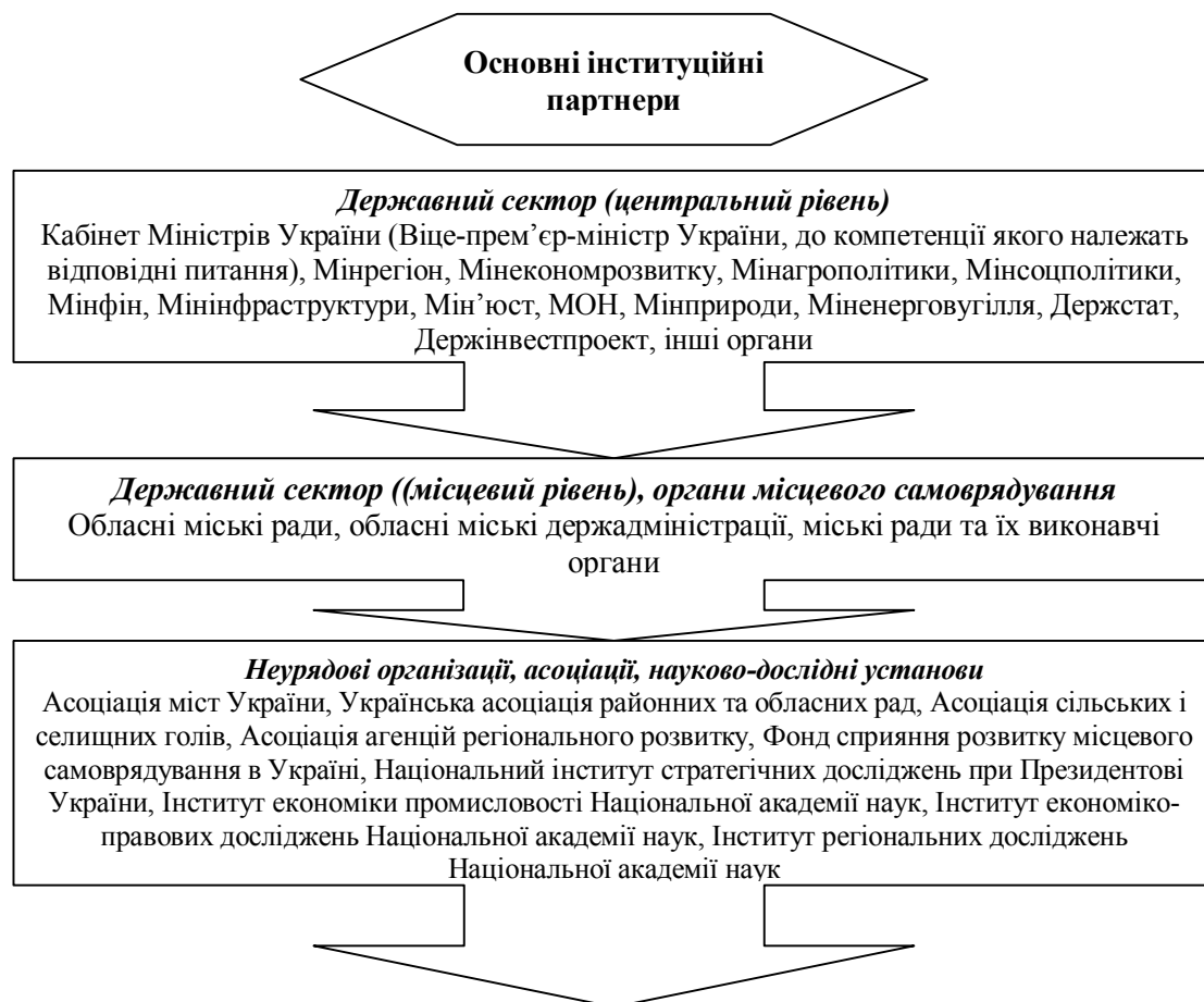
Рис. 1. Основні інституційні партнери реалізації Державної стратегії регіонального розвитку на період до 2020 року

Встановлено, що першочерговим документом держави щодо сільського розвитку є Єдина комплексна стратегія, а в основі більшості програм регіонального рівня закладена Стратегія регіонального розвитку на період до 2020 року. Основні інституційні партнери даної Стратегії наведено на рис. 1.