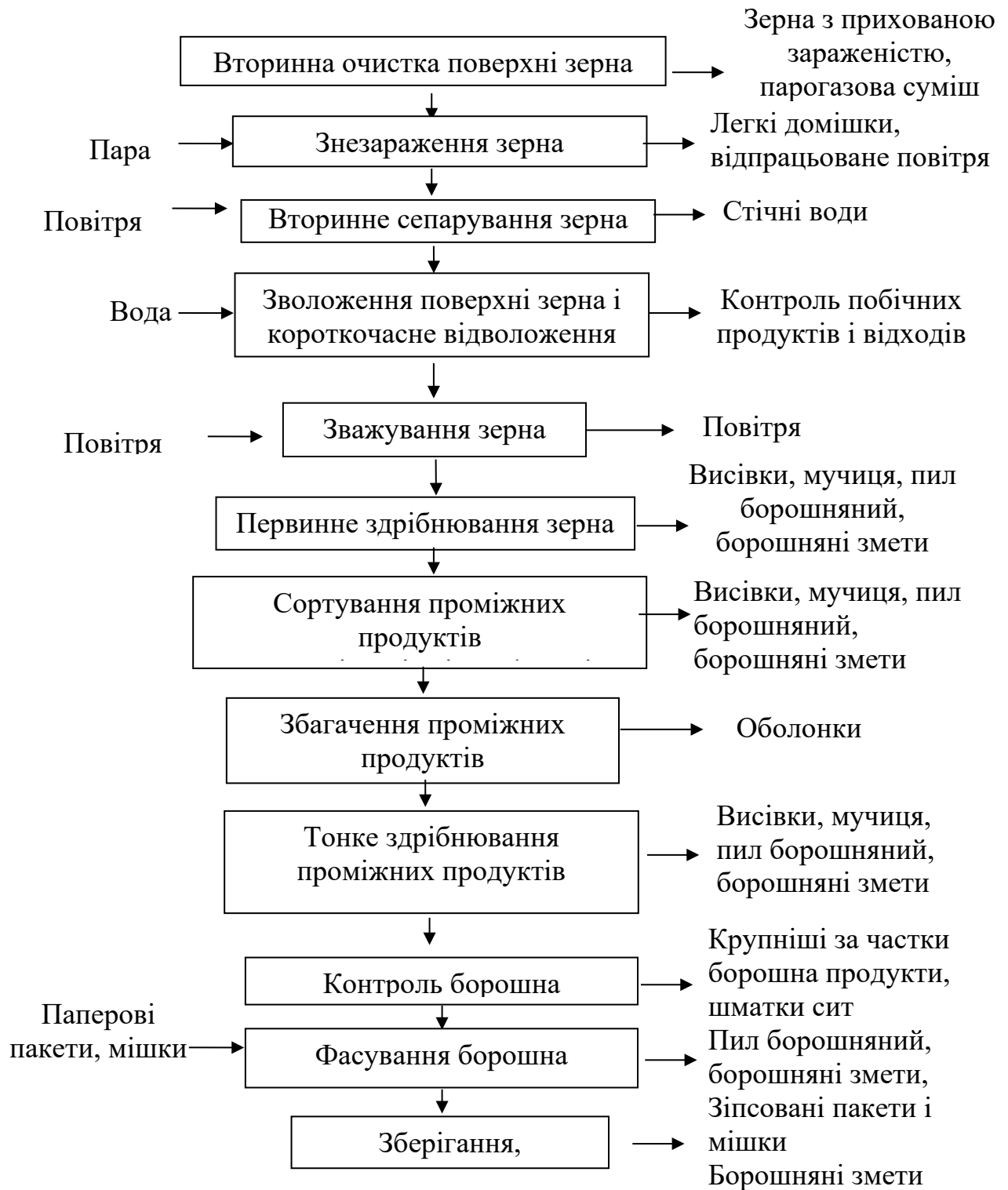
Рис. 1.1 – Технологічна схема виробництва борошна