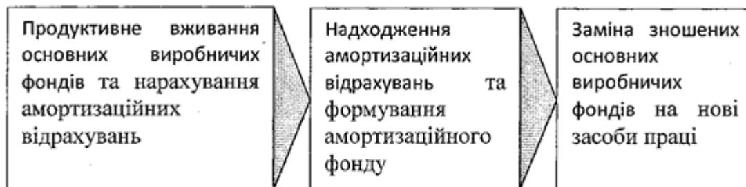
Рис. 1.1. Рух основних виробничих фондів на підприємстві

На третьому етапі у ході виготовлення проходить відновлення споживчої вартості частки основних виробничих фондів. Це оновлення відбувається через заміну зношених основних виробничих фондів на нові завдяки амортизаційному фонду.