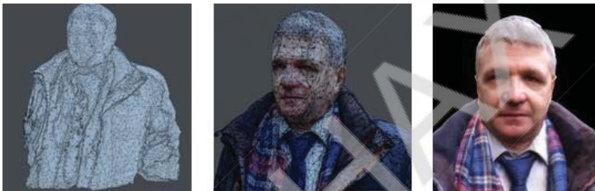
Рисунок 2 – Полігональна модель та отримане кінцеве зображення

Для формування 3D-зображення обличчя створюється полігональна (скелетна) модель [1-3] (рис. 2), кількість трикутників у якій залежить від кривизни складових поверхонь. Для кожної вершини трикутника визначаються вектори нормалей, які задають кривизну трикутника, а також вектори напрямку до спостерігача \vec{V} і джерела світла \vec{L} . Для подальших розрахунків ці вектори нормалізують. Для визначення дифузної та спекулярної складових кольору для всіх точок поверхні, обмеженої трикутником, визначаються вектори, перераховані раніше до всіх внутрішніх точок трикутника. Як правило, для цього використовують лінійне інтерполювання.