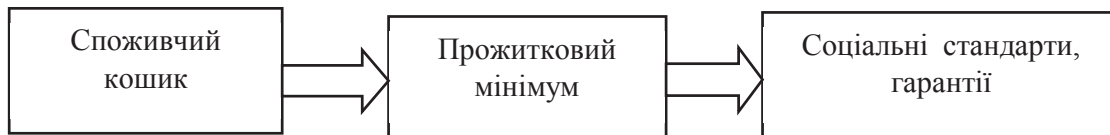
Рис.1 - Сучасний механізм взаємодії споживчого кошика,

прожиткового мінімуму, соціальних стандартів в українській економіці