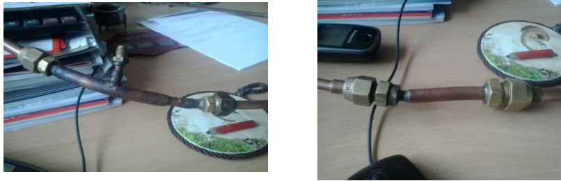
Рис1. Експериментальні дослідження парового контуру промислового кондиціонера під високим тиском