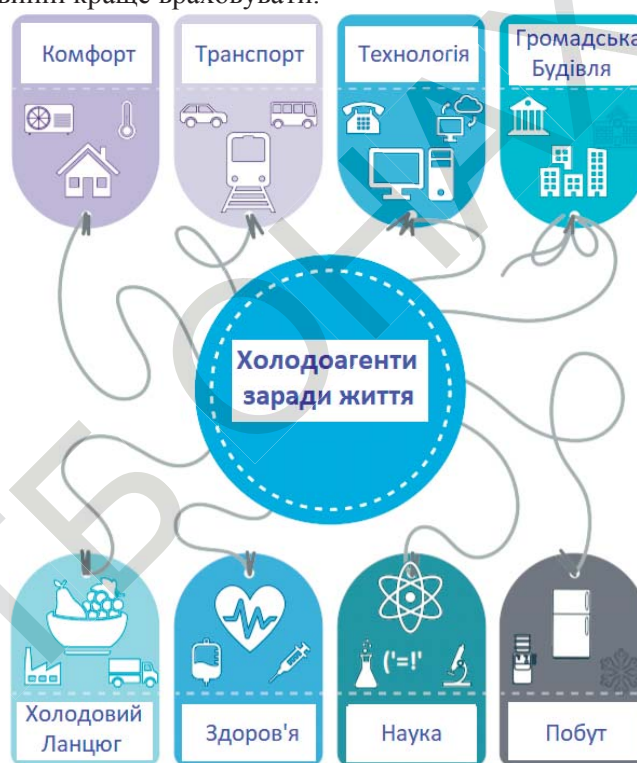
Рис.1 Вплив холодильного агенту

За оцінками ІІР, загальна кількість систем охолодження, кондиціонування повітря та теплових насосів, що працюють у всьому світі, становить приблизно 5 мільярдів. Світовий річний обсяг продажу такого обладнання становить приблизно 500 мільярдів доларів. Понад 15 мільйонів людей працюють по всьому світу в холодильній галузі, яка споживає близько 20% від загальної кількості електроенергії, яка використовується у всьому світі. Приведені статистичні дані, підкреслюють важливість галузі охолодження, яка, як очікується, зростатиме в наступні роки через збільшення потреб в охолодженні в багатьох сферах та глобальне потепління. Холодильна промисловість відіграє головну і зростаючу роль у сучасній світовій економіці і в житті людини рис.1, причому великий внесок у сферу харчування, здоров'я, енергетики та навколишнього середовища, які політики повинні краще враховувати.