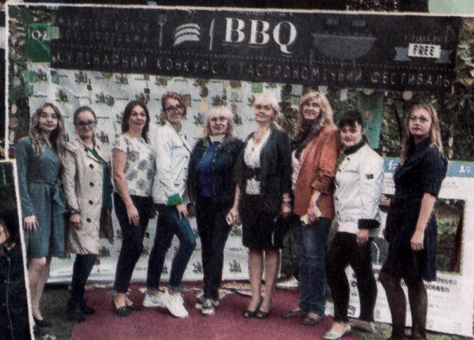
ВИКЛАДАЧІ ФАКУЛЬТЕТУ ІННОВАЦІЙНИХ ТЕХНОЛОГІЙ ХАРЧУВАННЯ І РЕСТОРАННО-ГОТЕЛЬНОГО БІЗНЕСУ ОНАХТ

Основна мета заходу – популяризація спеціальності готельно-ресторанної справи, залучення студентської молоді до кулінарного мистецтва і популяризація рестораної справи в Україні.