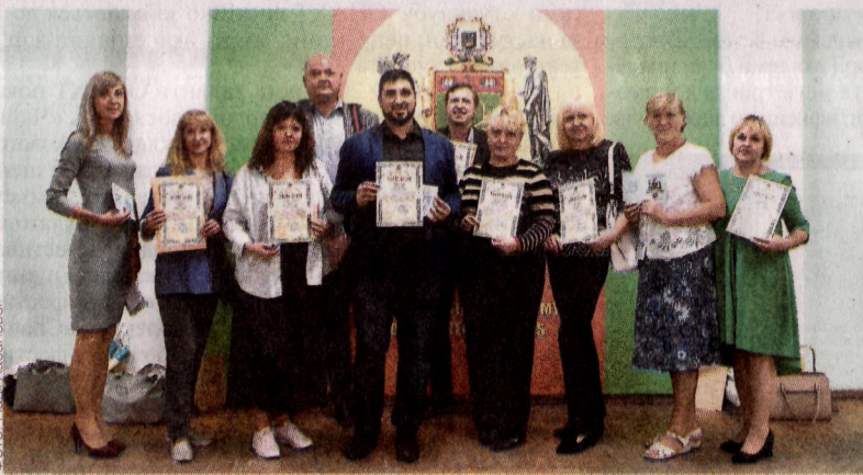
ВИПУСКНИКИ ВШПМ 2020 РОКУ

ти суть проблеми, проаналізувати її, знайти єдиний варіант її розв'язання з відповідних дисциплін. Тому так важливо мати навички роботи в цій системі.