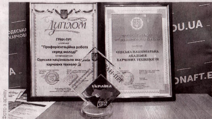
ГРАН-ПРИ У НОМІНАЦІЇ ПРОФОРІЄНТАЦІЙНА РОБОТА СЕРЕДЬ МОЛОДИ НА 34-Й МІЖНАРОДНІЙ СПЕЦІАЛІЗОВАНІЙ ВИСТАВЦІ ОСВІТА ТА КАР'ЄРА - ДЕНЬ СТУДЕНТА 2018

За останній рік в академії успішно впроваджено в освітній процес елементи змішаної освіти. Вперше в історії академії були проведені захисти дипломних робіт бакалаврів та магістрів за допомогою дистанційних платформ з надійною автентифікацією здобувачів.