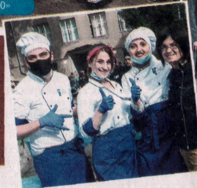
УЧАСНИКИ КОНКУРСУ «ВВQ-2020»

Осінній фестиваль-конкурс «ВВQ-2020» черговий раз став яскравим івентом, який зібрав студентів, викладачів, професійних шеф-кухарів, гостей у дворіку Одеської національної академії харчових технологій. Кулінарні перегони відбулися з нагоди святкування 118-ї річниці ОНАХТ.