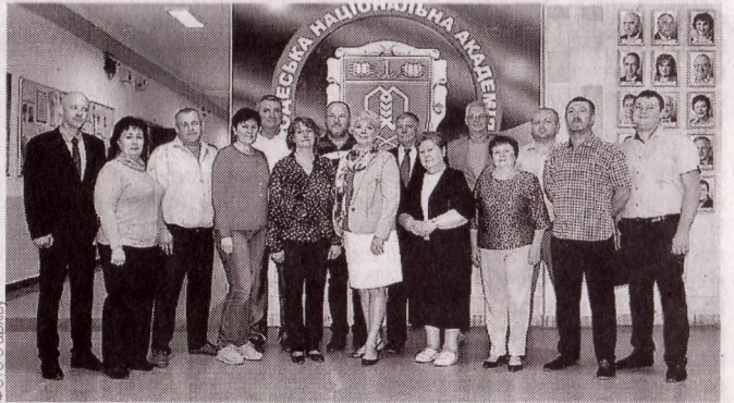
КОМАНДА АДМІНІСТРАТИВНО-ГОСПОДАРСЬКОГО ВІДДІЛУ ОНАХТ

Служба головного механіка провела роботи, направлені на економію теплоенергії, води та газу: заміну теплотраси в навчальних