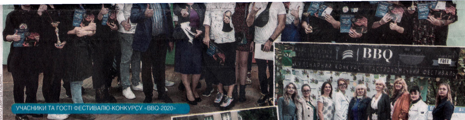
УЧАСНИКИ ТА ГОСТІ ФЕСТИВАЛЮ-КОНКУРСУ «ВВQ-2020»

Осінній фестиваль-конкурс «ВВQ-2020» черговий раз став яскравим івентом, який зібрав студентів, викладачів, професійних шеф-кухарів, гостей у дворіку Одеської національної академії харчових технологій. Кулінарні перегони відбулися з нагоди святкування 118-ї річниці ОНАХТ.