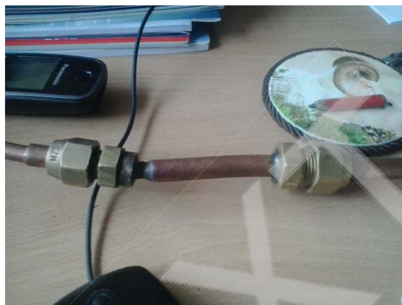
Рис1. Експериментальні дослідження парового контуру промислового кондиціонера під високим тиском

Перевірку можна проводити як на високому тиску (15-25кг), так і на вакуум. Набуті навички згодяться для монтажу холодильного устаткування теплової обробки повітря, окрім кондиціонера, ще і в доводчиках-рроросподілувачах.