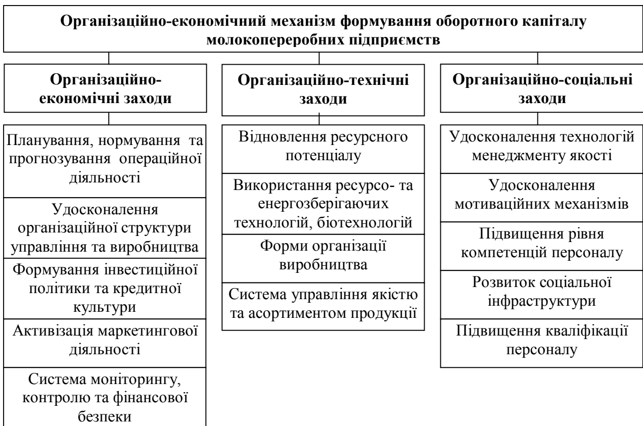
Рис. 2. Елементи організаційно-економічного механізму формування та використання оборотного капіталу молокопереробних підприємств

Обґрунтовано, що проходження кожної стадії обороту вартості оборотних активів супроводжується притаманним їм рівнем ризику і чим інтенсивніше рухаються інвестиційні потоки в процесі обороту вартості, тим більше фінансових ризиків вони генерують. Забезпечення мінімізації комерційних та фінансових ризиків, ефективного співвідношення джерел формування оборотного капіталу, результативних форм зовнішнього страхування, лімітування і розподілу ризиків між контрагентами, позбавлення окремих ризиків досягається в процесі розробки політики управління оборотним капіталом та певним чином залежить від менталітету власників та економічного потенціалу підприємства щодо мінімізації деструктивних чинників. Встановлено, що забезпечення постійної фінансової рівноваги і стабільності розвитку, що досягається побудовою раціональної структури джерел формування оборотних активів, забезпеченням їх синхронності, рівномірності надходження, що в кінцевому визначає стабільність фінансової архітектури аграрної сфери.