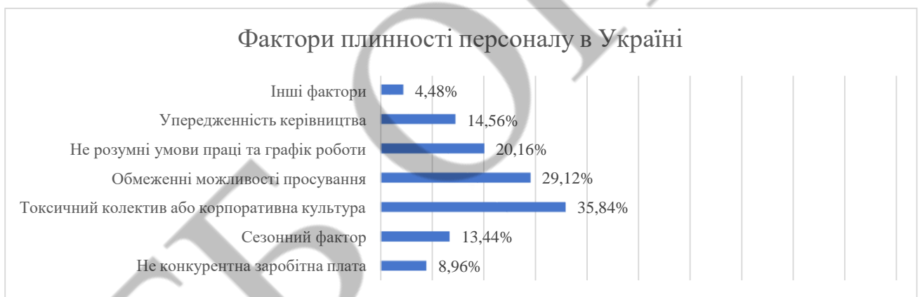
Рис.2. Фактори плинності персоналу в Україні

Провівши анкетування через google-форму (було опитано 112 респондентів) та виявлено у відсотковому значенні фактори плинності персоналу серед українців, рис.2.