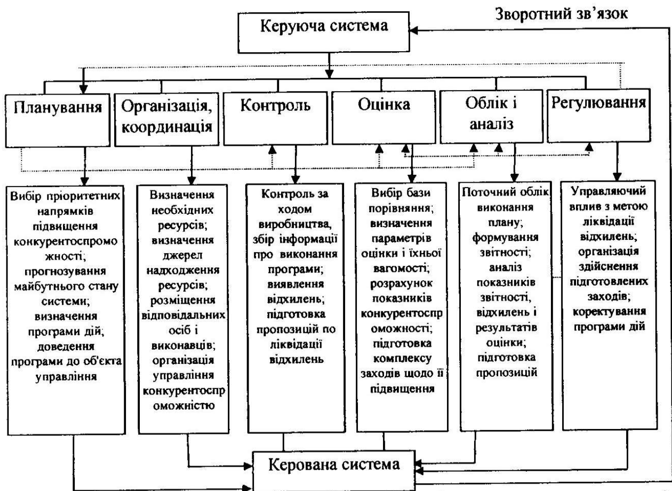
Рис. 4. Функціональна графічна модель управління конкурентоспроможністю рибної продукції

конкурентоспроможністю продукції на підприємствах рибної промисловості повинні скласти базові принципи: принцип орієнтації виробництва рибної продукції на ринкову кон'юнктуру; принцип цільової стратегії управління; принцип системності, комплексності управління конкурентоспроможністю; принцип орієнтації на кінцеві результати; принцип стимулювання. Як основні функції управління конкурентоспроможністю рибної продукції варто виділити наступні: планування підвищення конкурентоспроможності продукції; організація і координація управління; контроль забезпечення підвищення конкурентоспроможності; оцінка рівня конкурентоспроможності продукції; облік і аналіз процесів управління конкурентоспроможністю; регулювання процесів управління конкурентоспроможністю.