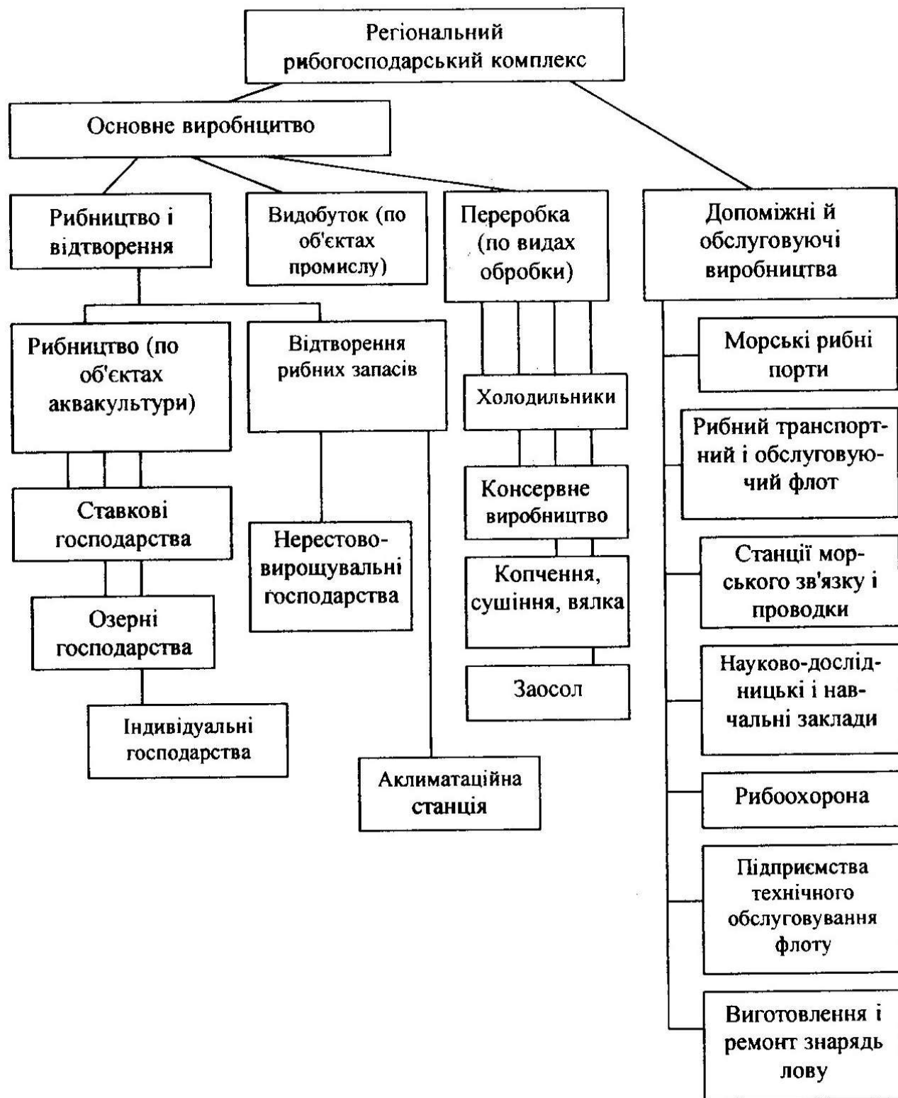
Рис. 3. Рибоводні підприємства у структурі регіонального рибогосподарського комплексу

методичний підхід до визначення вектора розвитку рибогосподарського комплексу, який базується на оцінці рівня внутрішньої активності по конкретному виду діяльності в регіоні за на підставі обчислення інтегрального показника по кожному підприємству.