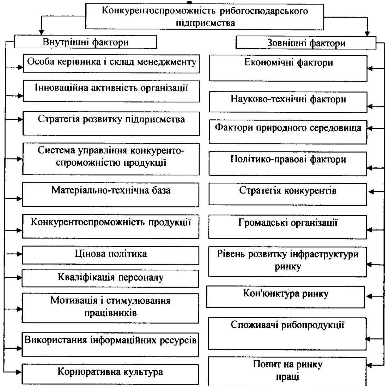
Рис. 1. Фактори, що впливають на конкурентоспроможність рибогосподарського підприємства

Рибогосподарський комплекс України завжди відігравав значну роль в забезпеченні країни продовольством, у постачанні сировини суміжним галузям національної економіки, підвищенні зайнятості населення. Водночас, рибне господарство є споживачем продукції та послуг значної кількості галузей країни, зокрема, машинобудування, транспорту та інших. Разом з тим, за останні десятиріччя в рибогосподарському комплексі України спостерігаються глибока структурна деформація і значне відставання від розвинутих країн світу.