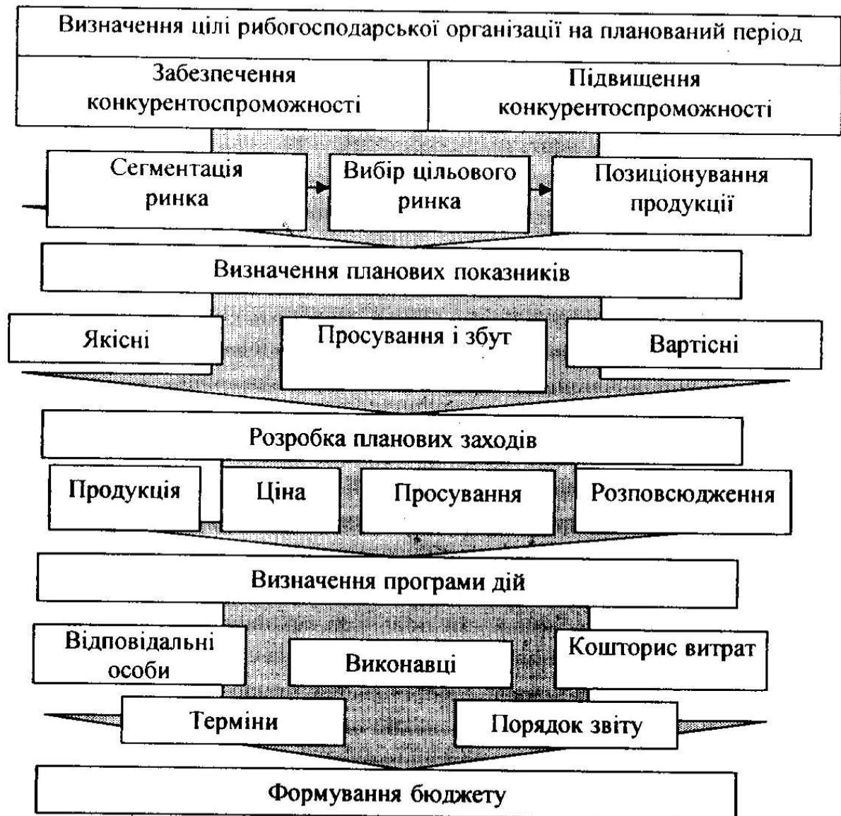
Рис. 5. Етапи планування конкурентоспроможності продукції

Розроблено і запропоновано систему планових показників конкурентоспроможності продукції рибогосподарських підприємств, які розділено на три групи: показники якості продукції; вартісні показники; показники просування і збуту. Оцінка показників конкурентоспроможності організації в динаміці дозволить виявити основні тенденції в галузевій конкуренції, визначити організації, що стабільно займають лідируюче положення, виявити "висхідні зірки".