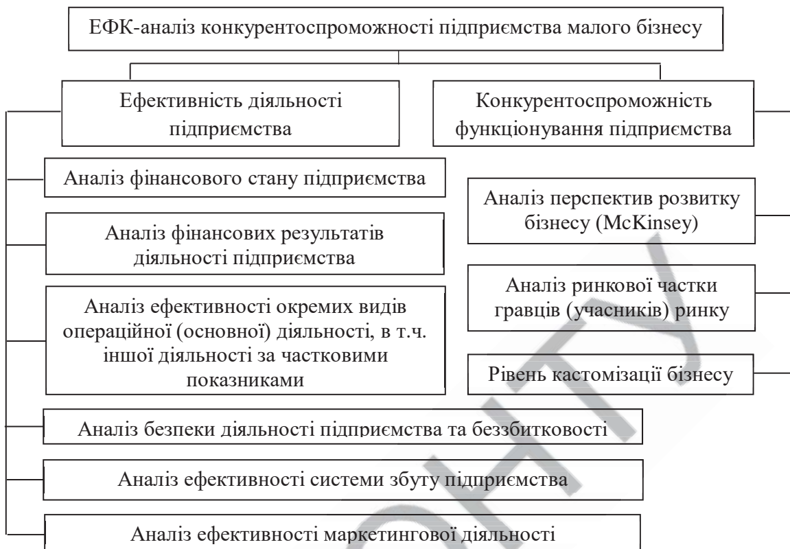
Рис. 2 – Схема проведення ЕФК-аналізу конкурентоспроможності підприємств малого бізнесу харчової промисловості*