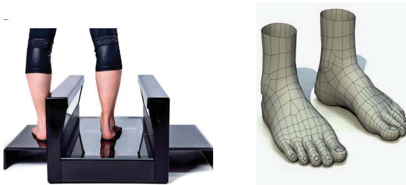
Рис. 1. Зображення 3D сканера ніг та отримана тривимірну модель

Отримана тривимірна модель може використовуватися для медичних досліджень, зокрема,