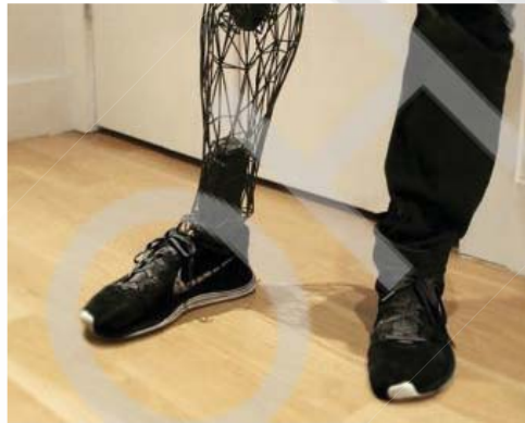
Рис. 3 – Вигляд протезу

Тривимірне моделювання широко використовується в галузі протезування.