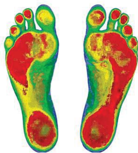
Рисунок 2 – Розподіл тиску

На підставі комп'ютерної діагностики стоп лікар ортопед-травматолог допомагає підібрати пацієнтові ортопедичне взуття, а також приймає замовлення на виготовлення індивідуальних устілок або татора.