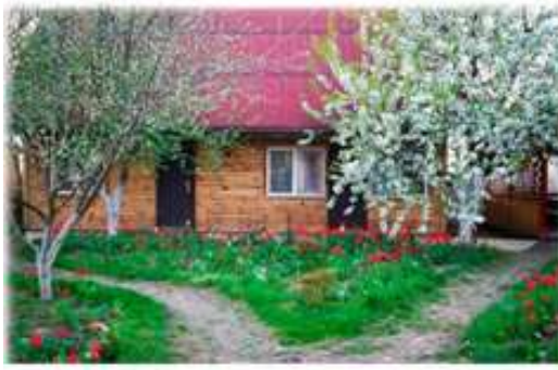
Садба «Тарасові шляхи», Моринці