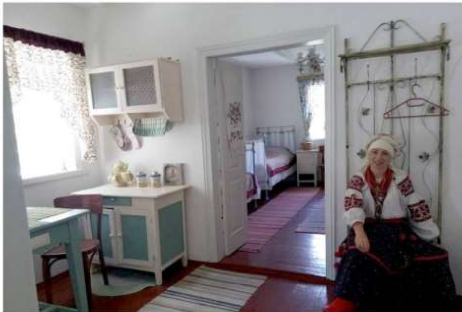
Рис. 2.3 – Еко-садиба зеленого туризму "Мальва Озерна" [33]