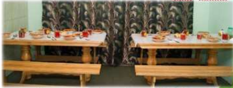
Їдальня, Садба «Тарасові шляхи», Моринці