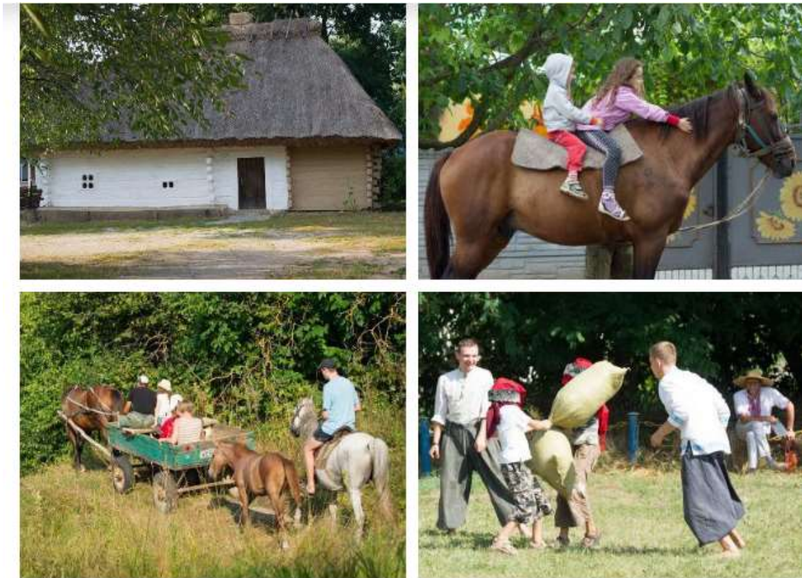
Рис. 3.7 – Види розваг в садибі «Тарасові шляхи», Моринці

Садиба «Тарасові шляхи» приймає гостей протягом усього року. Тут надають послуги з апітерапії.