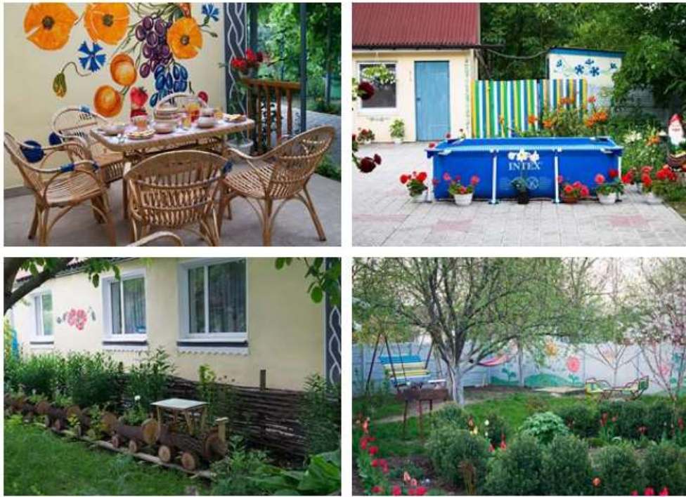
Рис. 3.6 – Інфраструктура садиби «Тарасові шляхи», Моринці