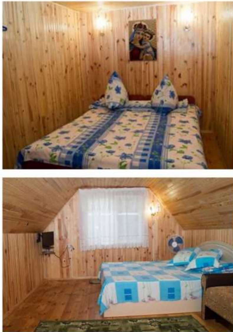
Рис. 3.4 - Садиба «Тарасові шляхи», Моринці, номерний фонд

В садибі надається повноцінне харчування, яке включене у вартість проживання. Гостей потішать смачні страви домашньої кухні, такі як борщ, вареники, пампушки та інші. Меню складається з урахуванням побажань гостей. Вранці можна насолодитися свіжим парним молоком (коров'ячим або козячим).