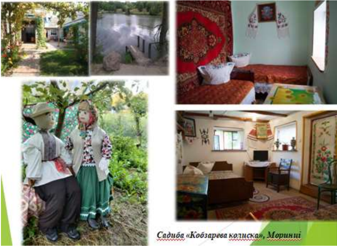
Садиба «Кобзарєва колиска», Морині