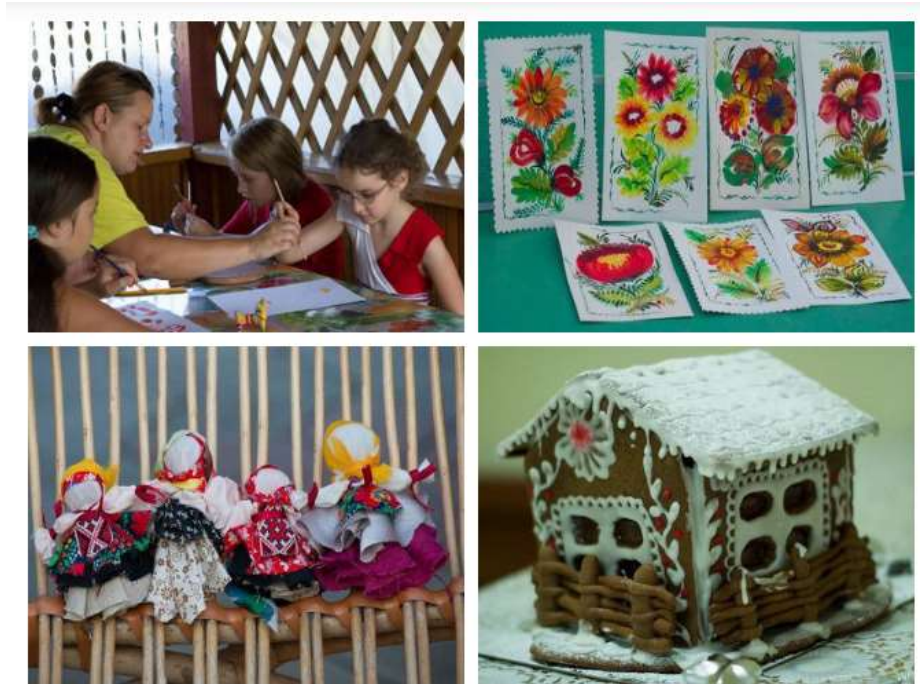
Рис. 3.5 – Майстер-класи, що проводяться в садиба «Тарасові шляхи», Моринці

Інфраструктура садиби складається з наступних пунктів (рис. 3.6):