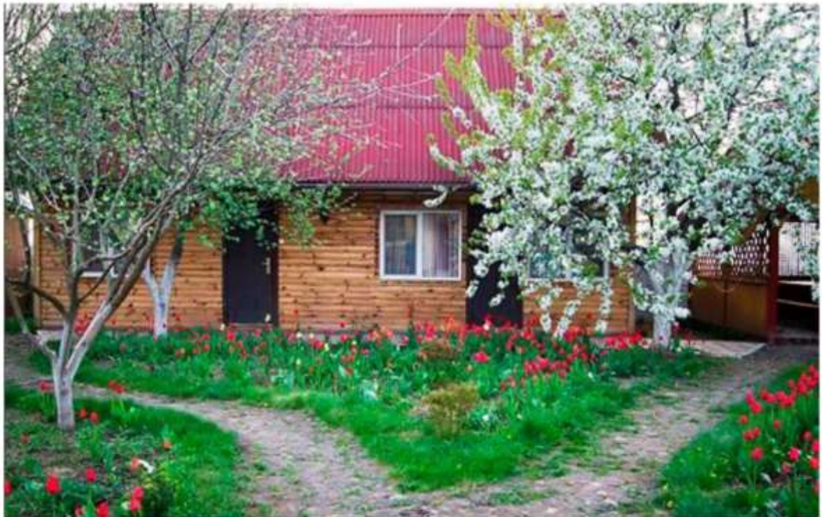
Рис. 3.1 – Садиба «Тарасові шляхи», Моринці

Садиба «Тарасові шляхи» (рис. 3.1, 3.2) в Моринцях пропонує затишні кімнати з усіма зручностями для проживання. 2-4-місні номери оснащені необхідними меблями, телевізором, санвузлом з душем та доступом до інтернету (рис. 3.3, 3.4).