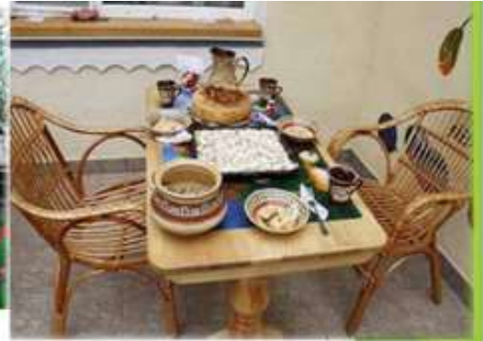
Місце для відпочинку, садба «Тарасові шляхи», Моринці