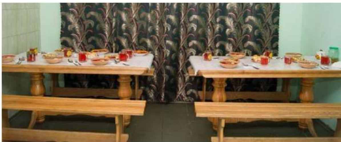
Рис. 3.3 – Їдальня, садиба «Тарасові шляхи», Моринці