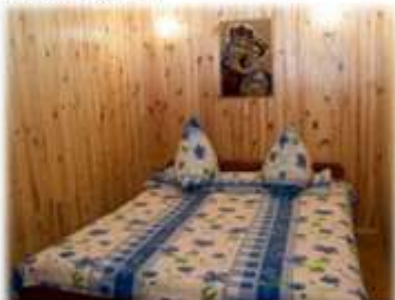
Садба «Тарасові шляхи», Моринці, номерний фонд