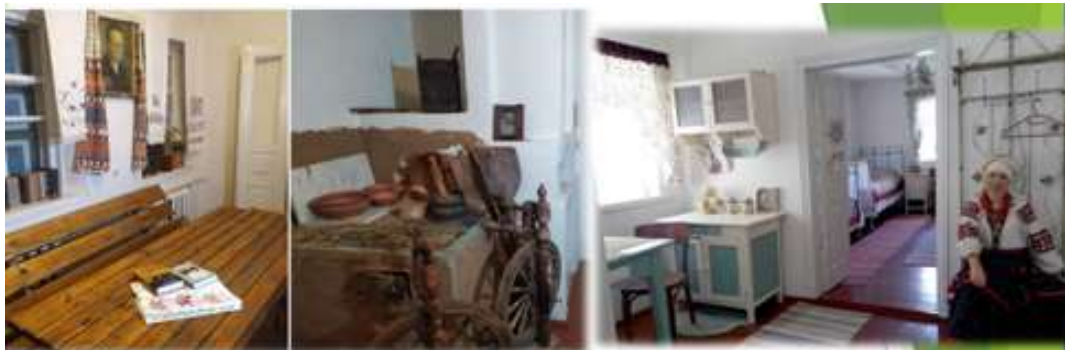
Хутір-садиба «Чорних запорожців»