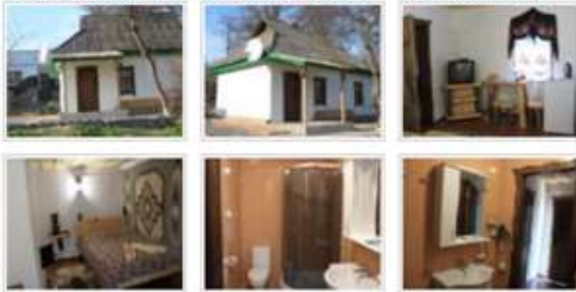
Садиба «Хата Отамана»