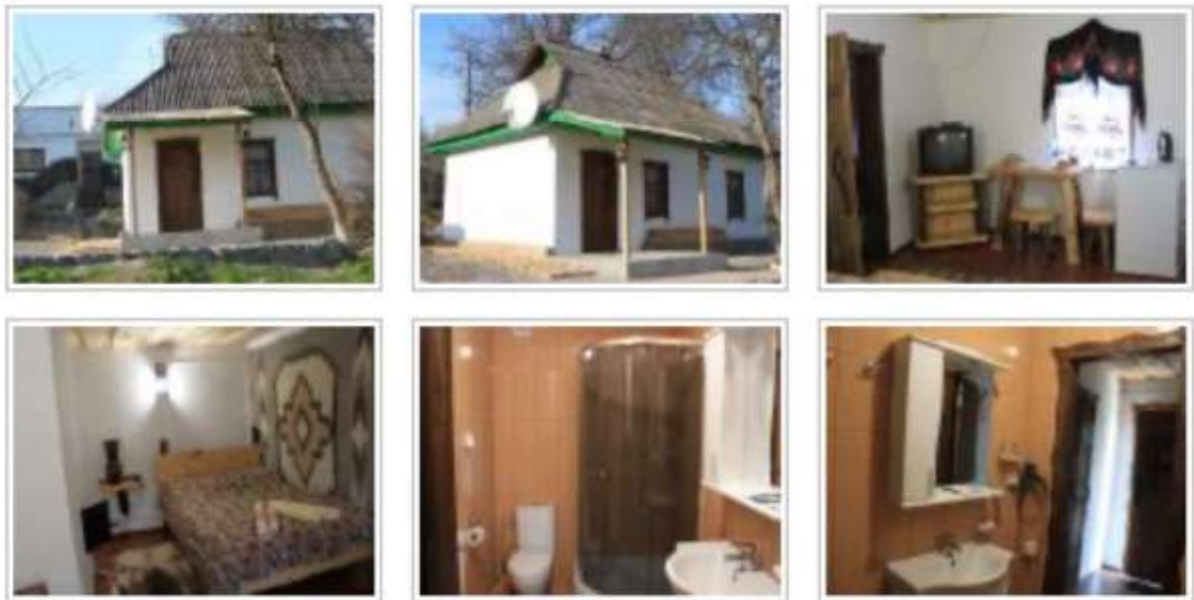
Рис. 2.4 – Садиба «Хата Отамана» [34]

В готельно-ресторанному та музейно-етнографічному комплексі "Дикий Хутір", розташованому поруч з віковим дубом Максима Залізняка в центрі Холодного Яру, є невеликий будинок. Його інтер'єр відтворює стиль української сільської хати. У двох кімнатах може розміститися до п'яти осіб. В них є комфортабельні меблі та деяка побутова техніка. Приміщення опалюється піччю. У будинку також є сучасний санвузол з душовою кабінкою. На території комплексу розташований ресторан з українською кухнею, а також лазня у вигляді чана на травах (рис. 2.4).