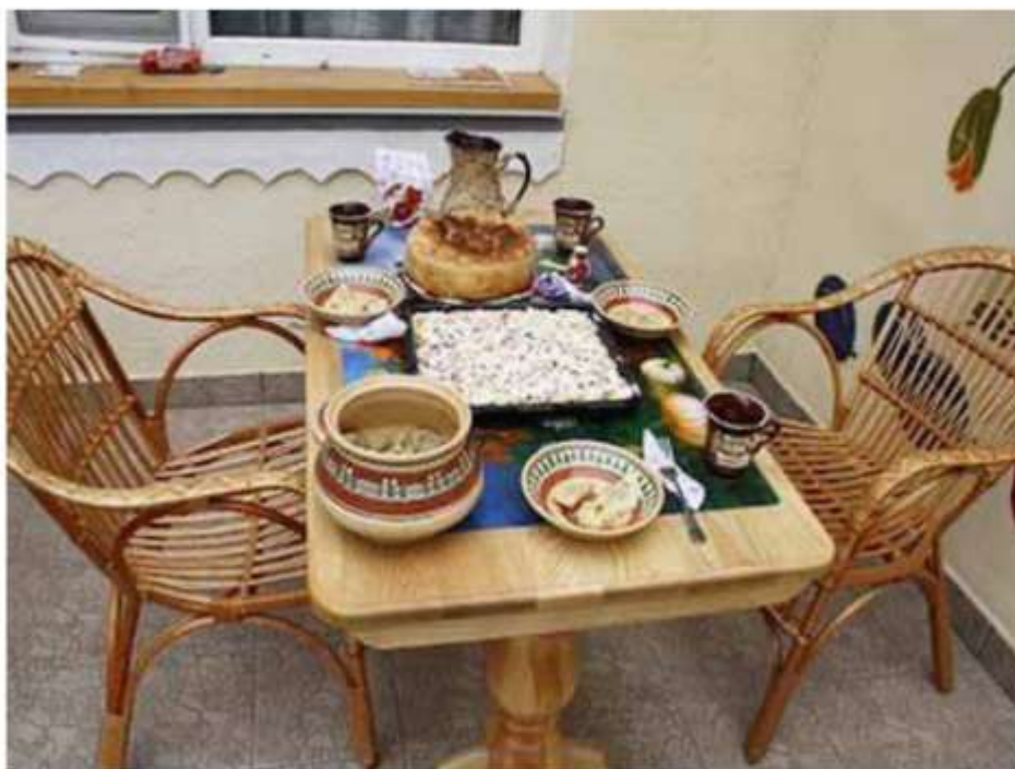
Рис. 3.2 – Місце для відпочинку, садиба «Тарасові шляхи», Моринці