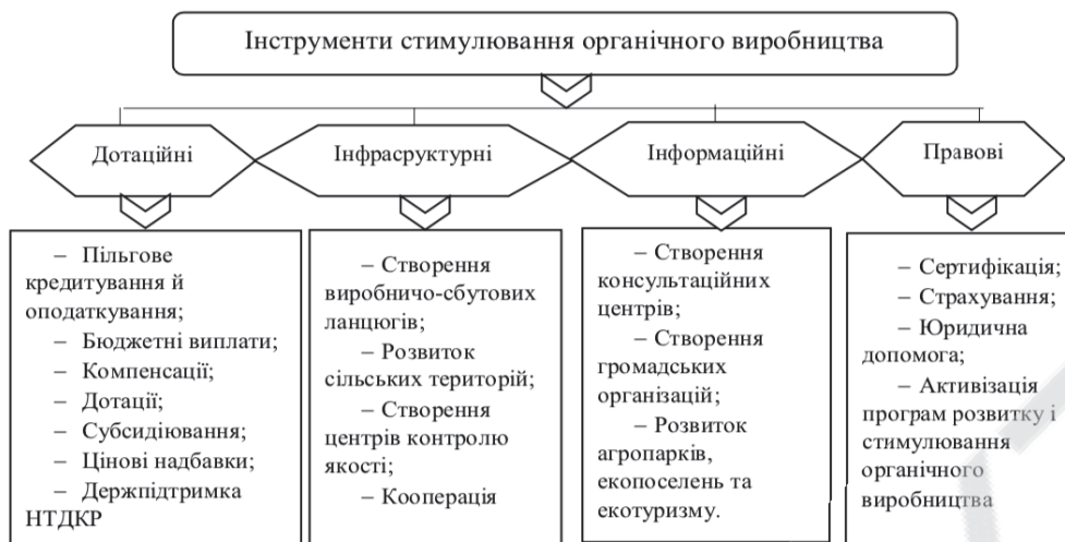
Рис. 3 - Інструменти стимулювання органічного виробництва

Висновок. Даний напрям господарської діяльності є достатньо ефективним в багатьох сферах, тому повинен стати пріоритетним для держави та аграрних підприємств. Органічне виробництво дає змогу активувати молодь до роботи на селі, привабити іноземних інвесторів, підвищити конкурентоспроможність на національному та міжнародному ринках та активізувати агробізнес в цілому.