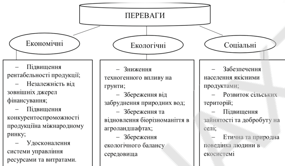
Рис. 1 - переваги органічного виробництва

держави, оздоровленням населення та покращенням екологічного стану країни. З огляду на це, органічне виробництво постає пріоритетним напрямком розвитку сільськогосподарського сектору економіки (рис. 1).