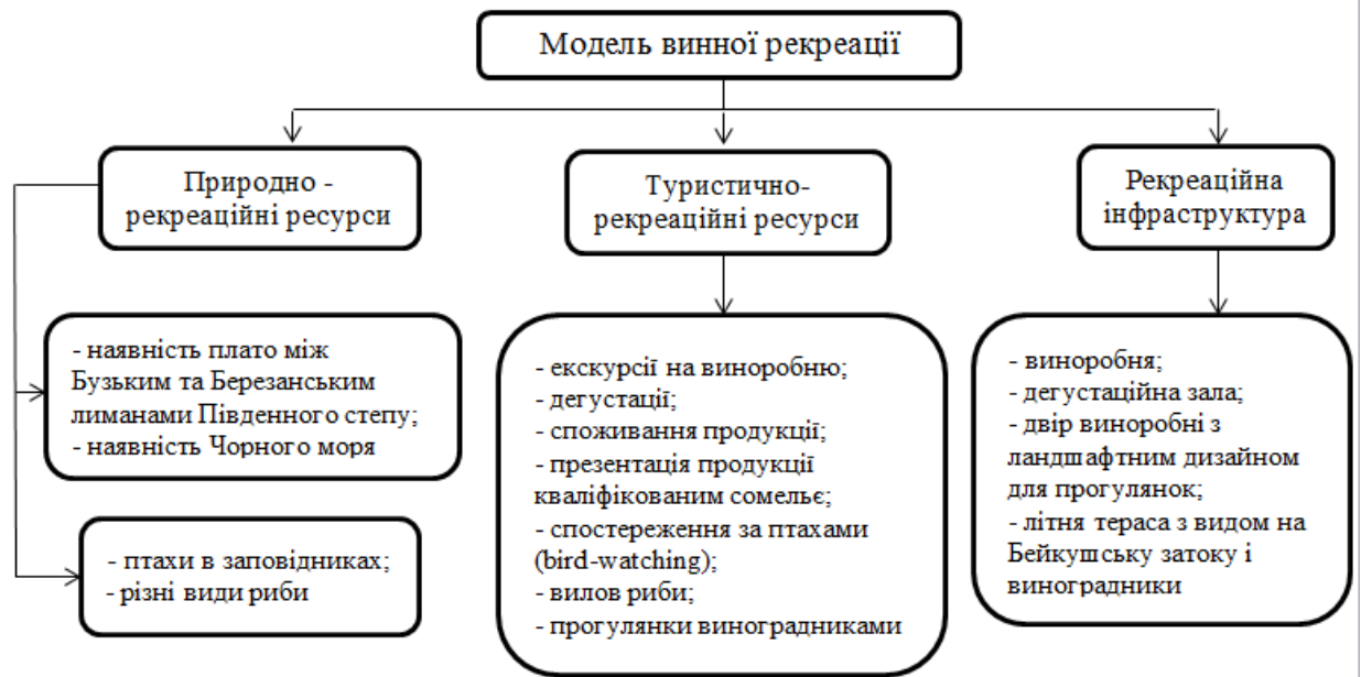
Рис. 3.3. – Модель організації винної рекреації на прикладі виноробні «Beukush winery»