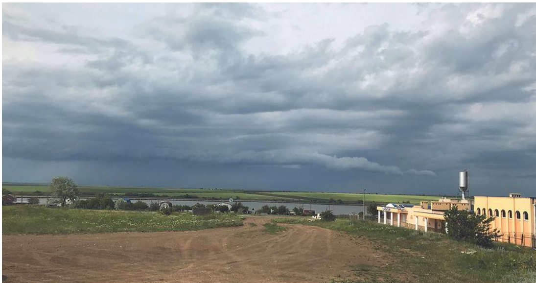
Рис. 3.2. - Виноробня «Veukush winery» - туристична локація

Кількість сонячних днів у році складає 225, середньорічна кількість опадів складає 400 мм. Ґрунти коричневі, глинозем. Площа посадки винограду сягає 11 га, висаджено ще 2 га молодого сорту Тельті-Кюрюк. Вік лози — 6 років.