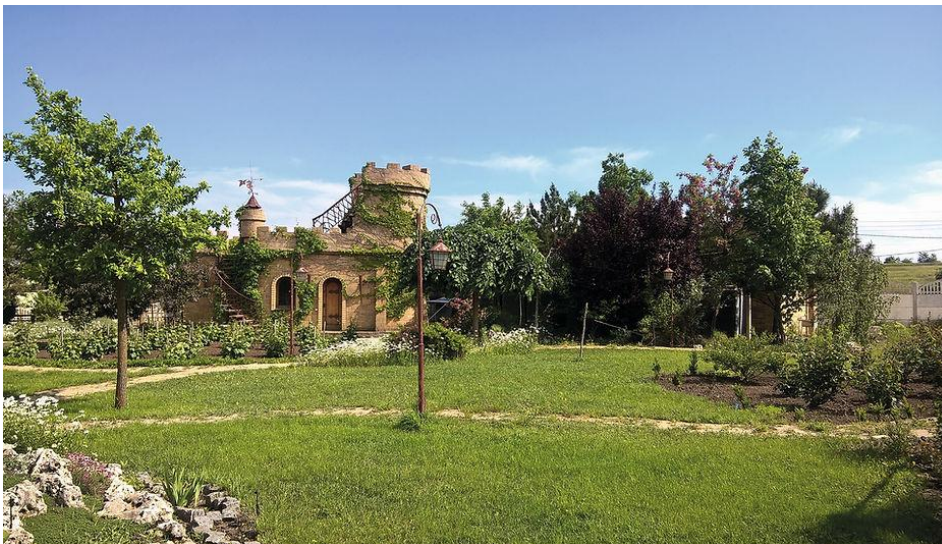
Рис. 3.1. - Виноробня «Beukush winery»

Виноробня «Beukush winery» знаходиться у с. Чорноморка, Очаківський район, Миколаївська область [49-50].