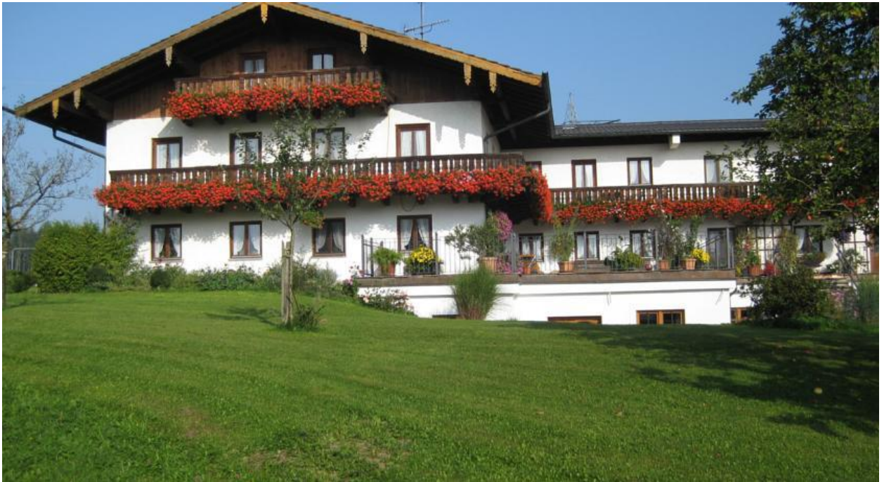
Рис. 2.15 - Фермерський будинок Wimmerhof