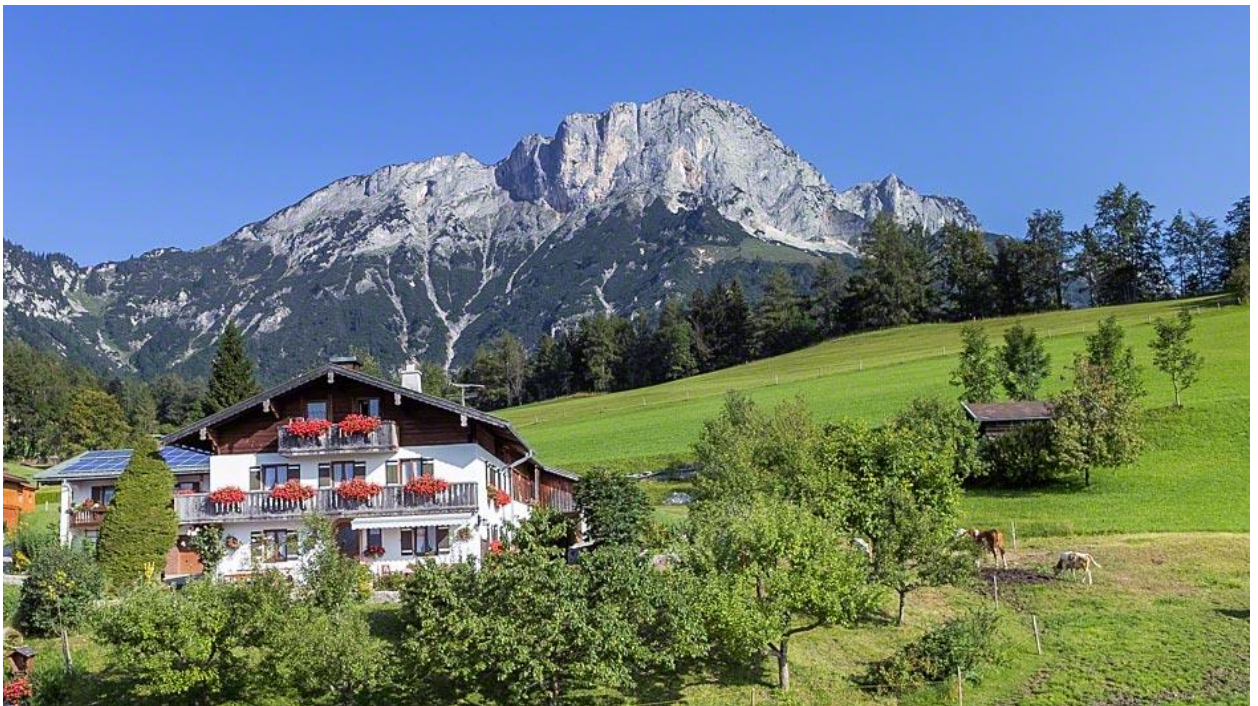
Рис. 2.7 - Bauernhof Vorderstiedler, сімейна ферма

Околиці чудово підходять для піших і велосипедних прогулянок, як згадувалося, гірськолижний курорт Дженнер знаходиться лише за 8 км, а інші визначні пам'ятки, наприклад, соляні копальні Берхтесгадена та озеро Кенігзеє, також знаходяться в безпосередній доступності. Столиця Баварії Мюнхен знаходиться приблизно за півтори години на північний захід, а до Зальцбурга в сусідній Австрії можна дістатися приблизно за півгодини.