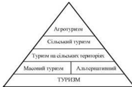
Рис. 1.1. - Піраміда видів туризму

У проблематиці щодо чіткого визначення різних видів туризму серед науковців нагальним є вирішення питання обґрунтованості виокремлення агротуризму, оскільки туризм, як і агротуризм, має на меті задоволення потреб туриста, що пов'язані з подорожуванням, пізнанням, відпочинком, рекреацією чи спортом. Тому виникає питання, чи є ознаки, які дають змогу відрізнити агротуризм від інших видів туризму? Якщо так, то виокремлення агротуризму є обґрунтованим. Усе частіше в межах туризму вирізняють галузеві спрямування, наприклад, туризм, пов'язаний з виготовленням вина ( wine tourism ), гастрономічний туризм ( food tourism ), екотуризм тощо. Та все ж основним чинником залишається відвідання селянського господарства і сільських територій. Немає причин, щоби не розмежовувати агротуризм і суто сільський туризм. Отже, відповідь на це запитання принаймні є частково позитивною.