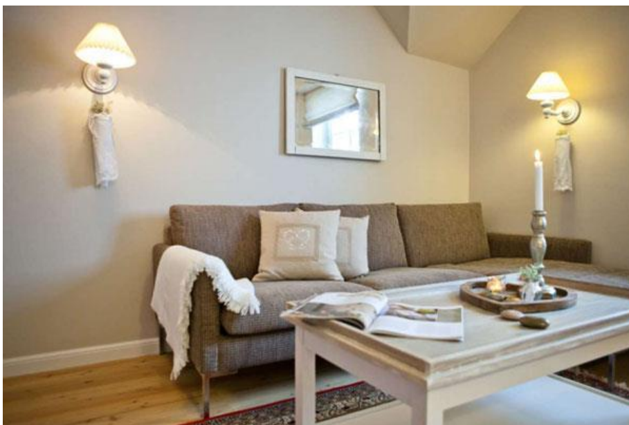
Рис.3.1 а - Ферма «Відпочинок із родиною Вульф», Німеччина

Між полями та дамбою розташована ферма, яка радує сім'ї.