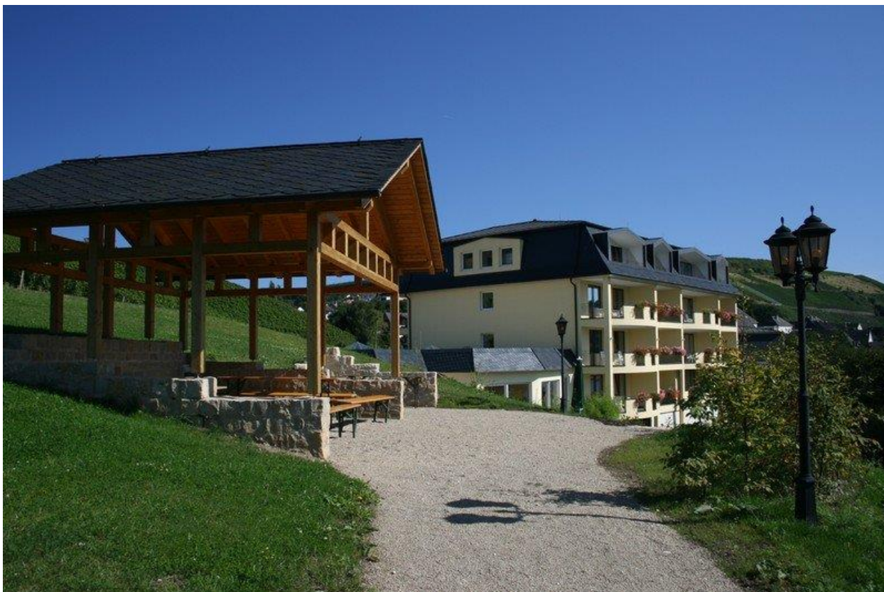
Рис. 2.5. – Готель Weingut Weis, Німеччина