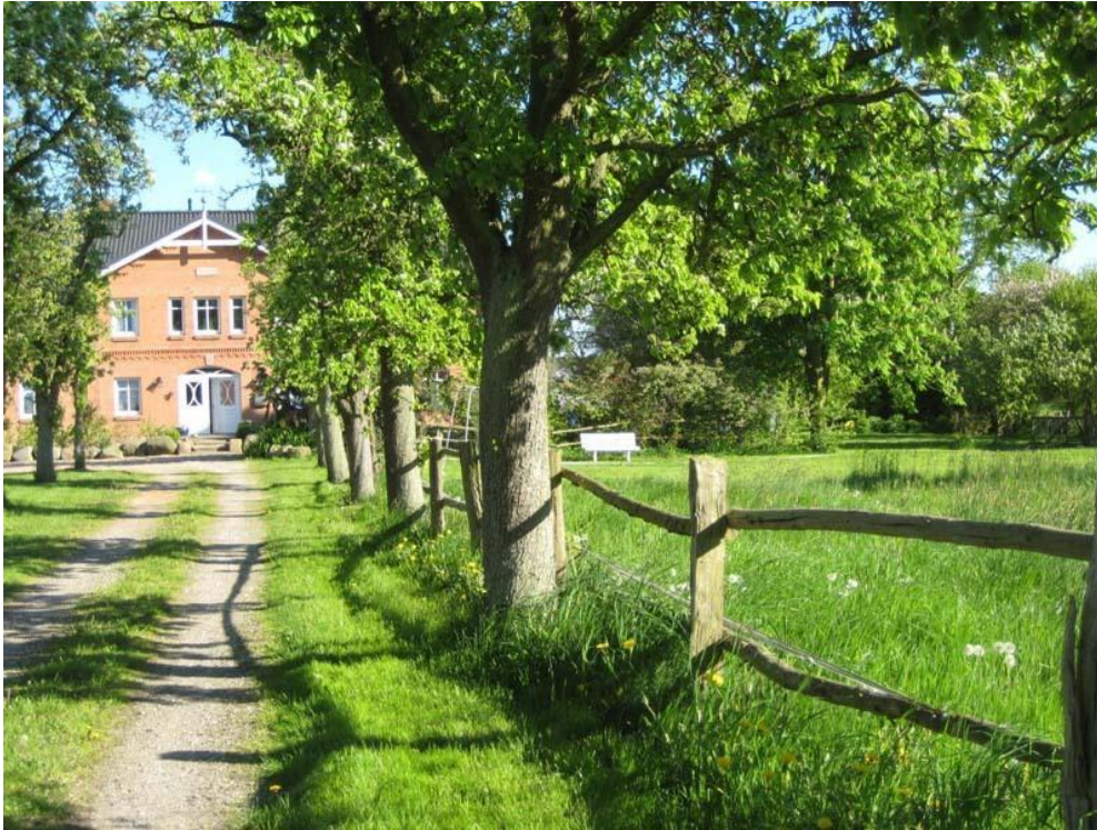
Рис. 2.6. – сімейна ферма Hof Faasel – Bauernhofurlaub an der Ostsee

повністю обладнаною кухнею, телевізором, DVD-програвачем і безкоштовним Wi-Fi на всій території.