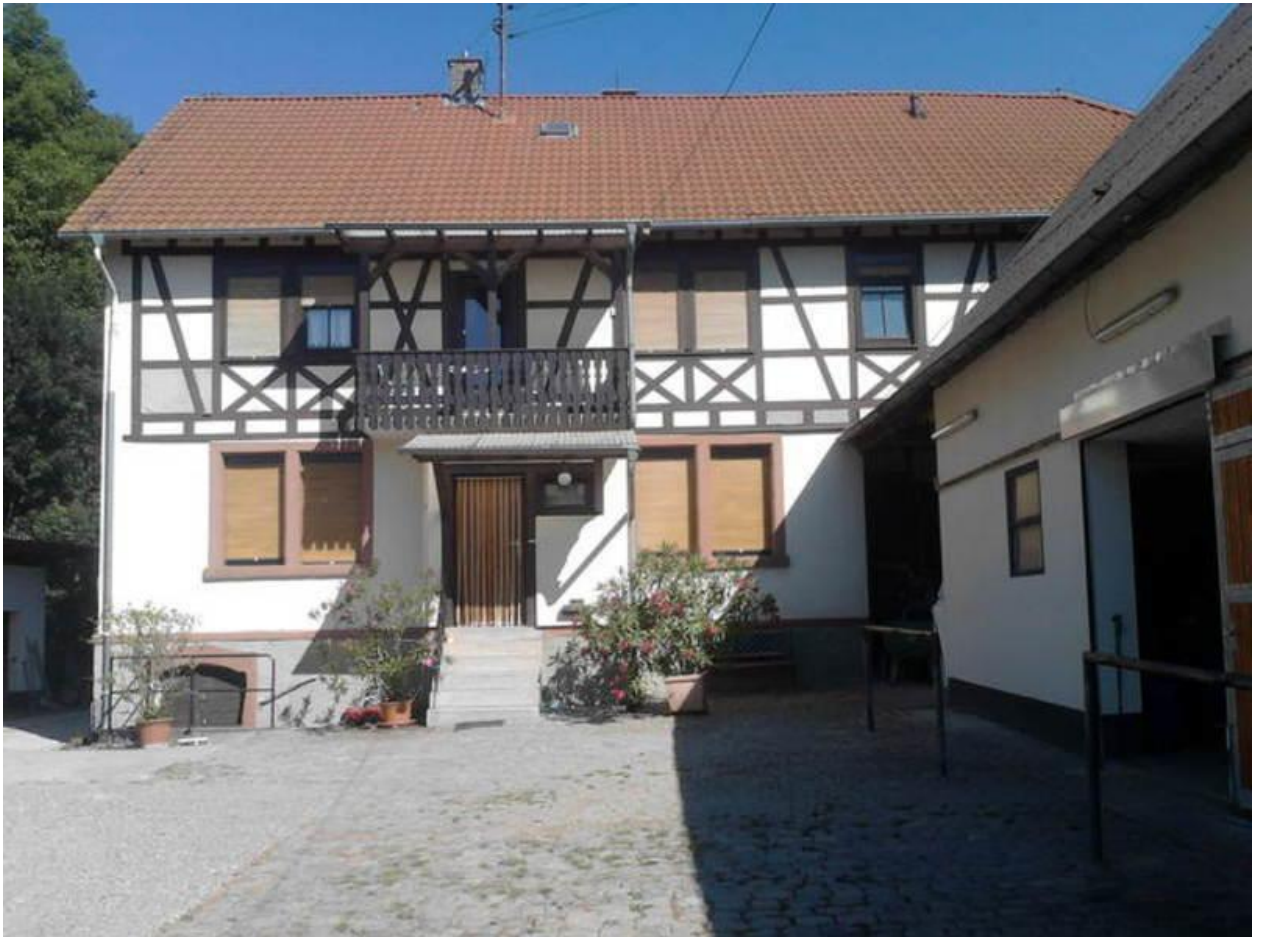
Рис. 2.12 – сімейна ферма Pferdehof und Wanderreitstation Dorsam