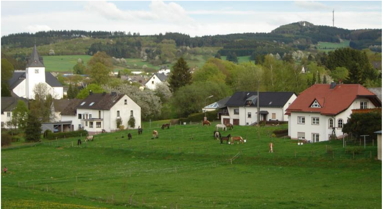
Рис. 2.8 - Urlaub auf dem Bauernhof Marx, сімейна ферма

Для дітей є ігровий майданчик і катання на поні у великих садах, які також мають терасу та обладнання для барбекю. А в околицях є багато можливостей для піших та велосипедних прогулянок.