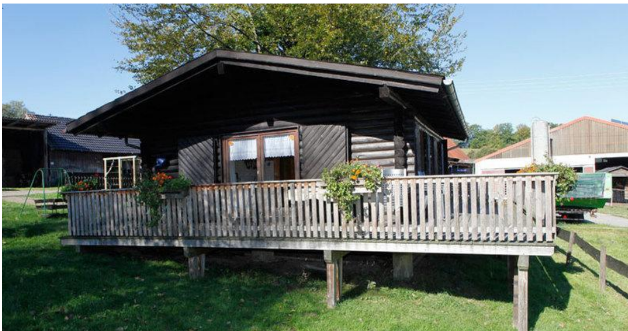
Рис. 2.3. - Фермерський будинок Varenhof

Фрма підходить для сімейного відпочинку з великою кількістю сільськогосподарських угідь, коровами та конями, де діти можуть зустрітися, а також дитячим майданчиком і майданчиком для барбекю в саду. У кожному номері є безкоштовний Wi-Fi і телевізор.