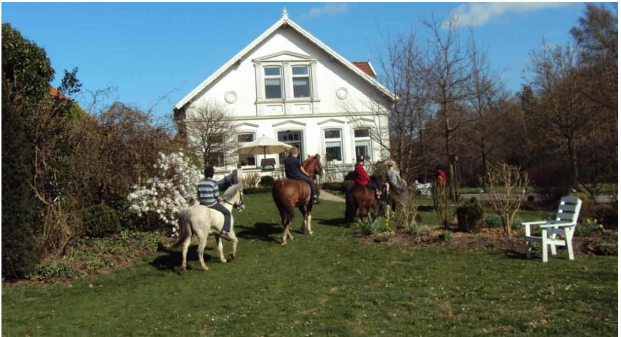
Рис. 2.10 - Готель Hof Auf Der Wurp

На фермі є обслуговування номерів, ви можете безкоштовно взяти напрокат велосипеди, а також покататися на конях, а навколишню багату сільську місцевість, повну низьких зелених полів і численних каналів, є багато цікавого для вивчення на конях або велосипедах.