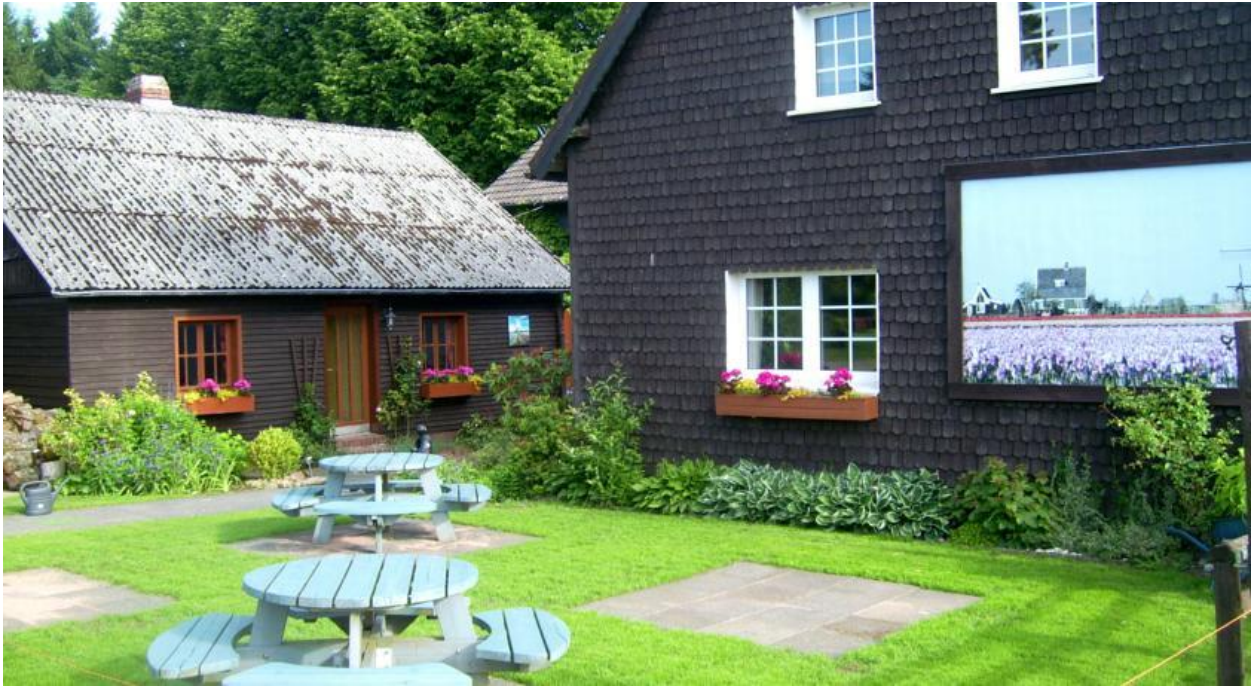
Рис. 2.13 - Пансіонат Ferienparadies Heidehof

До послуг гостей гарна тераса з приладдям для барбекю, а привітна команда стійки реєстрації може організувати такі заходи в околицях, як катання на гірських велосипедах і стрільба з лука. У сезон також можна покататися на лижах у сусідньому центрі зимових видів спорту Weißer Stein.