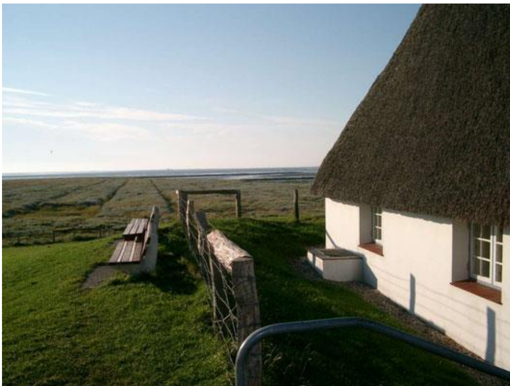
Рис.3.1б - Ферма «Відпочинок із родиною Вульф», Німеччина