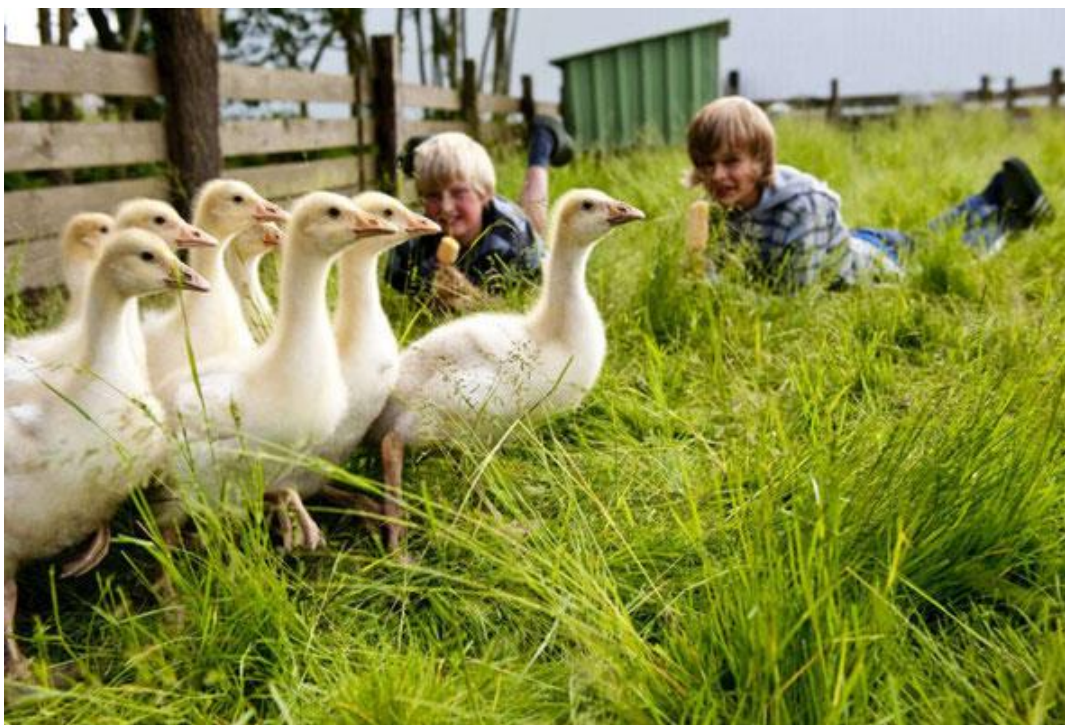
Рис.3.1 в - Ферма «Відпочинок із родиною Вульф», Німеччина [38]