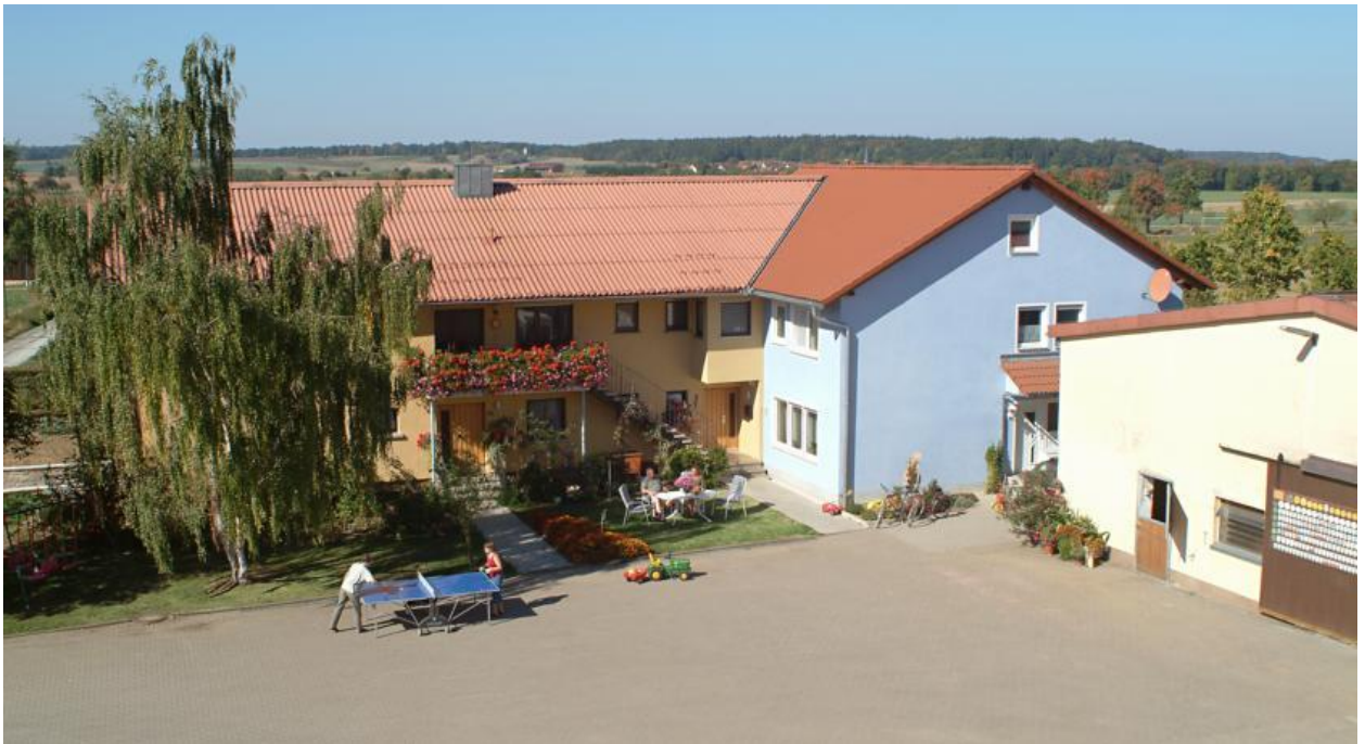
Рис. 2.4 - Ferienhof Arold, сімейна ферма

В околицях ви знайдете кілька чудових пішохідних стежок, а також катання на конях і хорошу рибалку та озера для купання.