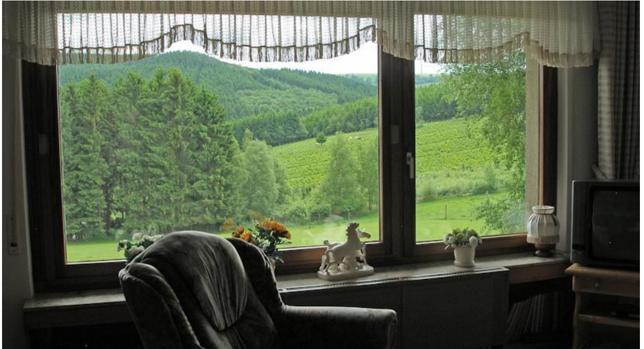
Рис. 2.9 – фермерський будинок Ferienhof Норре

Околиці, Зауерланд, справді красиві та відомі своїми пішохідними стежками. А взимку лише за 1 км від ферми можна зайнятися зимовим спортивним центром Wildewiesse.