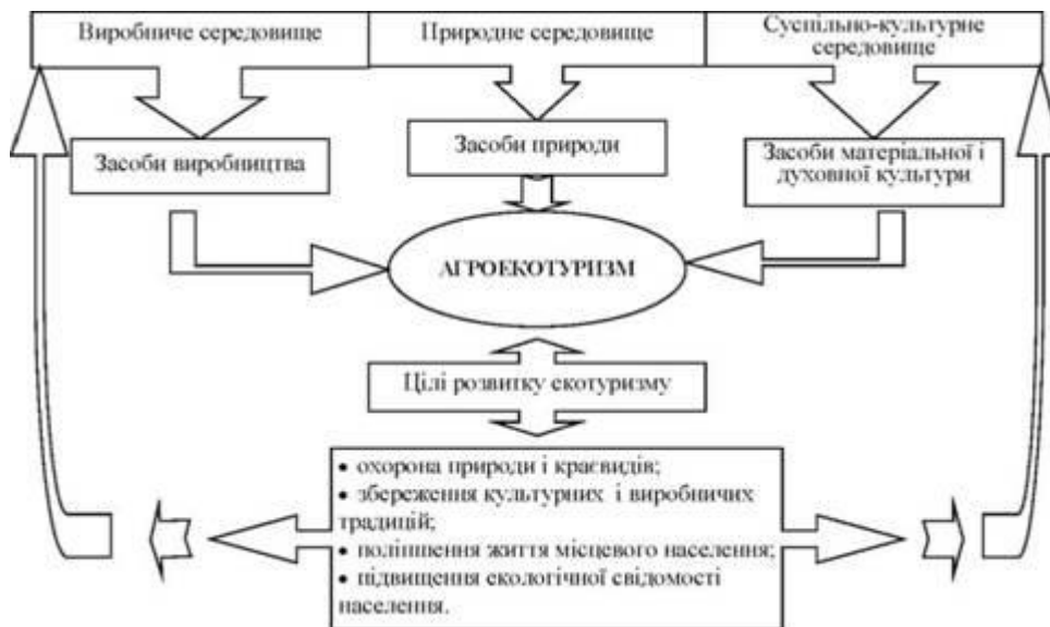
Рис. 1.2 - Взаємозалежності між цілями розвитку агроекотуризму та засобами середовища

Отже, агроекотуризм — це відпочинок у селянській родині, яка займається сільським господарством органічними (біологічними) методами (у господарствах, які мають відповідні сертифікати чи знаходяться в процесі екологічного перепрофілювання) [4].