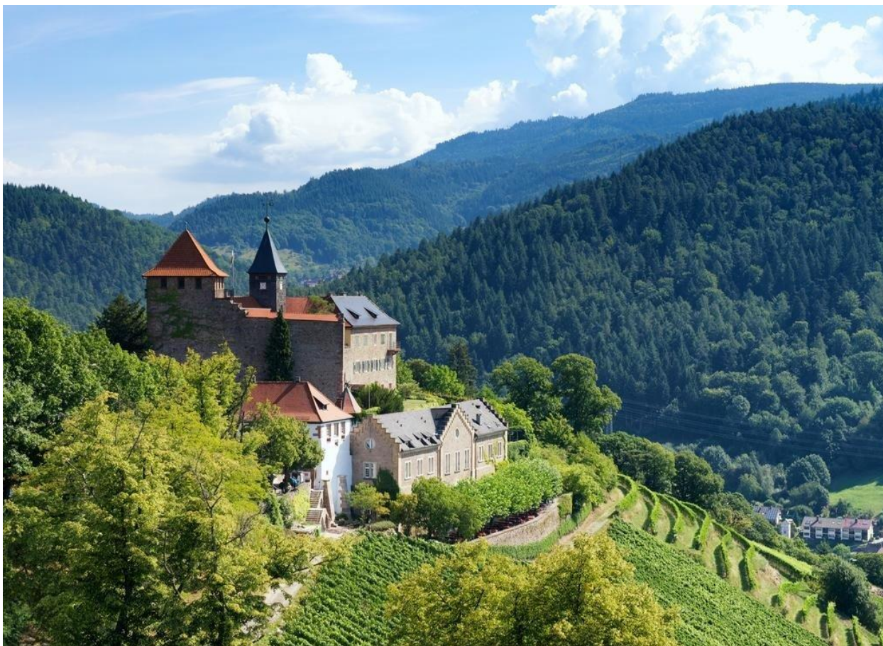
Рис. 2.11 - замок Schloss Eberstein, Німеччина