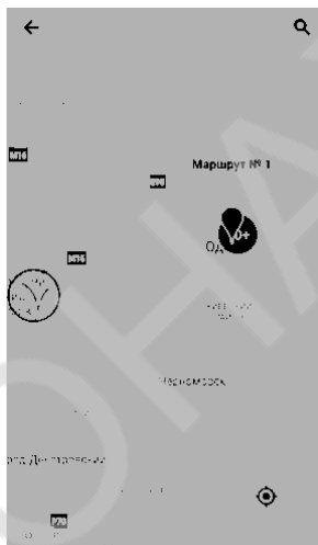
Рис.2 – Розділ «Карта»

У розділі «Карта» користувач має можливість додавати інформацію про місця, уражені амброзією, переглядати саму карту з ураженими місцями та створювати маршрути (Рис.2). Завдяки геолокації користувач може зрозуміти, чи знаходиться він в місці з ураженими амброзією ділянками. При натисканні на уражені ділянки можна побачити вікно з короткою інформацією про ділянку. А при натисканні на інформаційне вікно відкриється екран з фото ділянки, даними про щільність кущів, дату створення мітки, опис до локації та ким відмічена ця локація.