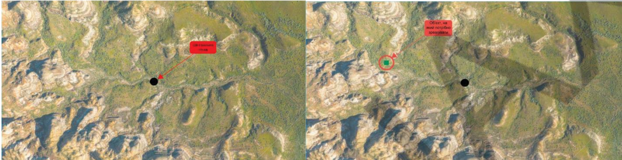
Рисунок 1 – Процес активного тестування а) зображення центральної точки, б) поява нової геометричної фігури

Розроблена програма забезпечує тренування динамічних і колористичних реакцій операторів. Тренування полягає в тому, що на екрані з'являється центральна точка, на якій потрібно зосередити увагу (рис 1.а). В подальшому на будь-якій частині екрану з'являтимуться геометричні фігури різного кольору та розміру, на які оператор повинен зреагувати, натиснувши на них лівою кнопкою миші, при цьому не відводячи погляд від центральної точки (рис 1.б). Натиснення вважається вдалим, якщо оператор зумів натиснути на об'єкт перед появою іншого. У іншому випадку фігура зникає, і натиснення вважається невдалим.