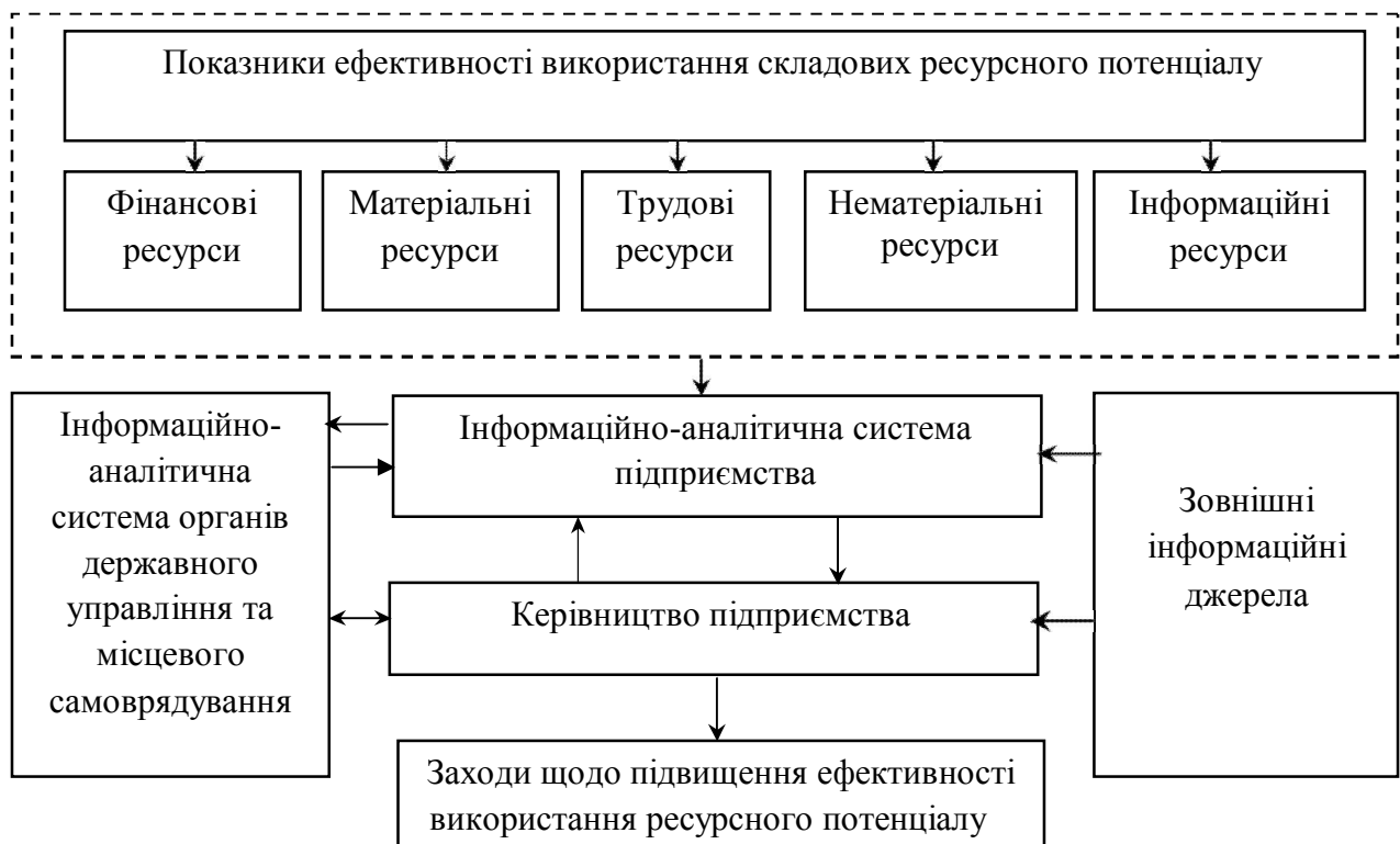
Рис. 2. Організаційно-інформаційна модель оцінки ефективності використання ресурсного потенціалу аграрного підприємства

Загалом оцінка ефективності використання ресурсного потенціалу базується на системі показників, які можна згрупувати за напрямками використання виробничих ресурсів. Ефективність використання ресурсного потенціалу на рівні підприємства знаходить своє відображення в обсязі виробництва продукції сільського господарства та допоміжних виробництв, обсягах та напрямках витрат (собівартості) на виробництво конкретних видів продукції та послуг, і, в підсумку, в обсягах отриманого прибутку, рівні рентабельності та загальній конкурентоспроможності підприємства. Організаційно-інформаційну модель оцінки використання ресурсного потенціалу сільськогосподарських підприємств представлено на рис. 2.