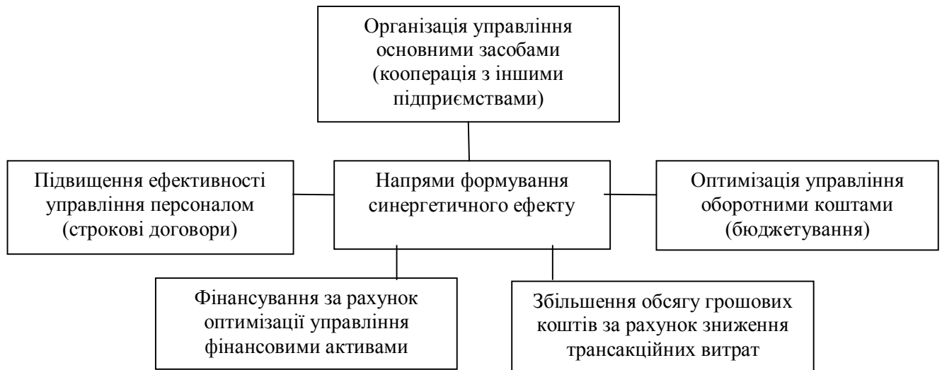
Рис. 3. Схема формування синергетичного ефекту від оптимізації використання ресурсного потенціалу підприємства шляхом мобілізації внутрішніх резервів

Не виключена наявність синергетичного ефекту від ефективного використання окремих видів ресурсів як у сільському господарстві, так і будівництві, хімічній промисловості, транспорті, харчовій промисловості та міжгалузевого впливу цього ефекту (рис. 3).