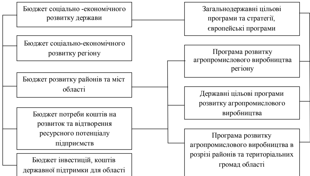
Рис. 4. Схема системної взаємодії при запровадженні бюджетування відтворення та розвитку ресурсного потенціалу аграрних підприємств

аграрної галузі країни. А для запобігання надмірних та необґрунтованих витрат, на нашу думку, необхідним є запровадження системи бюджетування відтворення та розвитку ресурсного потенціалу підприємств, що узгоджується між всіма рівнями національної економіки (рис. 4).