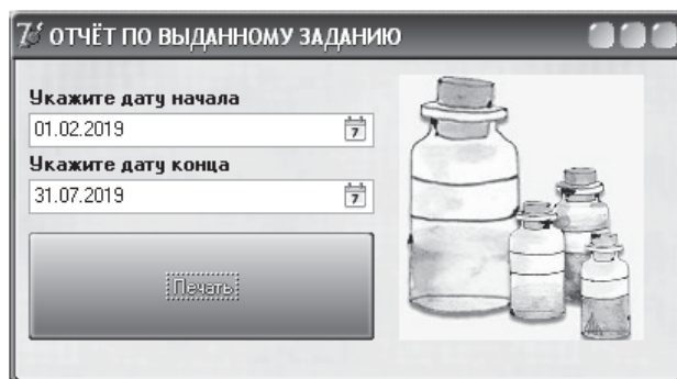
Рис.3 – Форма створення звіту

Перевагою даної системи є її оперативність і технологічність обробки даних, а також її відносно невелика вартість і маленький термін окупності.