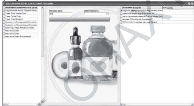
Рис.1 – Головна сторінка програми

Мета, яка була поставлена в роботі, виконана. На Рис.1 показана головна сторінка створеного програмного продукту, а на Рис.2 наведена форма внесення інформації про інгредієнти, які входять до складу крему.