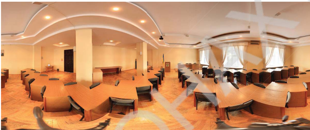
Рисунок 1 – 3D панорама конференц-зали

Основною метою дослідження є підвищення зацікавленості одним з корпусів Одеської національної академії харчових технологій (ОНАХТ) - Навчально-науковим інститутом холоду, кріотехнологій та екоенергетики ім. В.С.Мартиновського та заклик до його відвідування за допомогою створення 3D туру. Таким чином, веб-сайт інституту з можливістю перегляду тривимірної візуалізації прогулянки по інституту та його території значно підвищить рейтинг ВУЗу та приверне увагу абітурієнтів до академії. Студенти та абітурієнти можуть використовувати тур для орієнтування в академії, знати, де знаходяться деканати, бібліотеки, конференц-зали, тощо (Рисунок 1). Також, даний 3D тур може зацікавити студентів і викладачів не тільки даного, а й інших ВУЗів, так як він буде розміщений у відкритому доступі. В подальшому, тур можна використовувати на Днях відкритих дверей, ярмарках вакансій, це буде зручно для швидкого ознайомлення з академією. Головною перевагою 3D туру для користувача, замість звичайних фото, є створення «ефекту присутності» в точці зйомки.