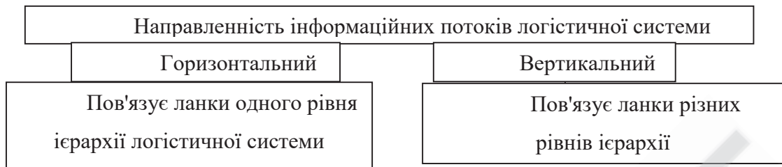
Рис. 2 – Залежно від виду систем, що пов'язуються потоком [Розроблено автором на основі [2]

Важливо зазначити, що просунуті ІТ компанії працюють, як правило, за наступним алгоритмом [проаналізовано та систематизовано автором]: