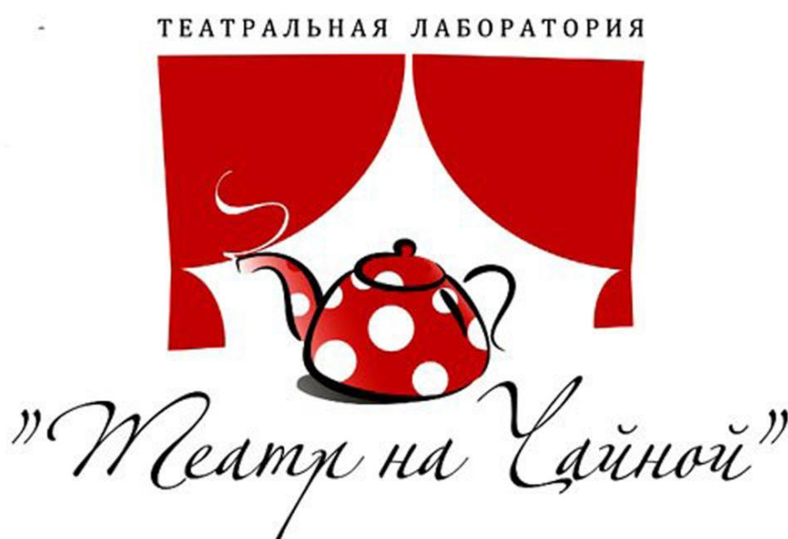
Рис. 2.16 – Логотип театру «Театр на Чайній», м. Одеса

Це такий собі аналог зникаючого проекту - Будинок Актора, де постановки здійснюють кілька режисерів, з абсолютно різним режисерським задумом. Об'єднані вони одним - крихітним залом на 50 чоловік, де глядач і актор максимально близькі один до одного.