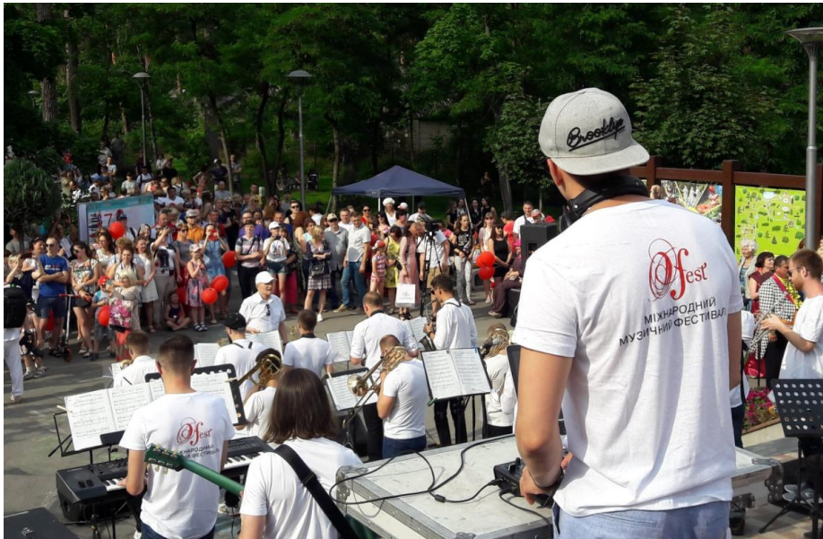
Рис.2.2. - Фестиваль- лабораторія «Український театральний детектив – дітям!», м. Одеса

Тим часом, у другій половині червня в Одесі очікується на проведення всеукраїнського фестивалю-лабораторії – «Український театральний детектив – дітям!». Цей проєкт буде реалізовано на базі Одеського ТЮГу імені Юрія Олеші, цільова аудиторія – як діти, так і дорослі.