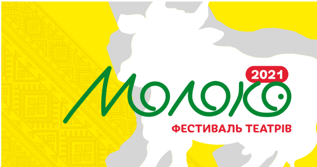
Рис. 2.1. - Афіша фестивалю «Молоко», м. Одеса

2-7 липня в Одесі відбудеться популярний фестиваль театрів «Молоко». Ідеолог та організатор форуму, режисер Михайло Журавель каже «Главкому», що через карантинні обставини іноземних гостей на фестивалі, на жаль, не буде - кордони і ризики. Але буде доволі насичена українська театральна програма.