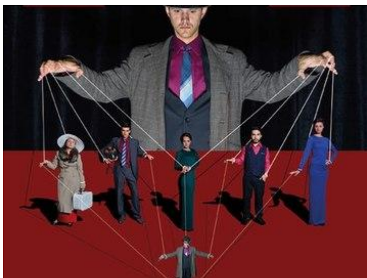
Рис. 2.15 - Одеський болгарський драматичний театр