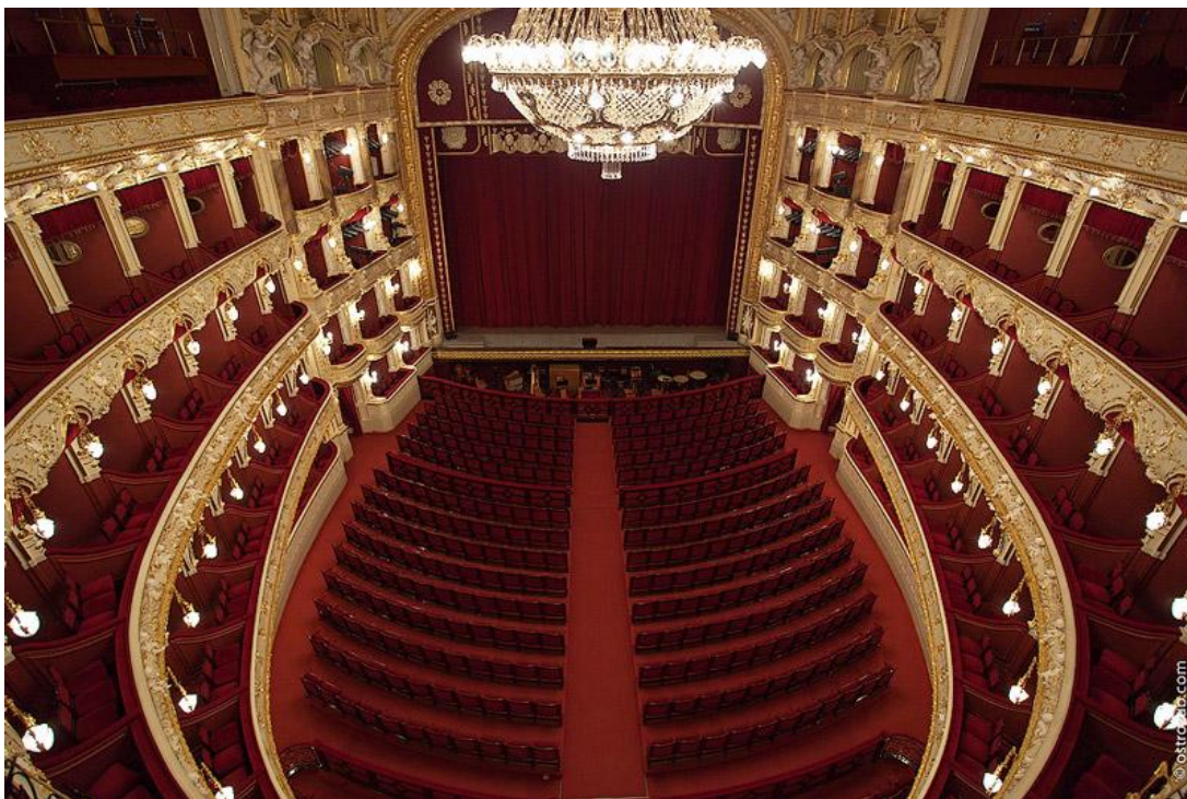
Рис. 2.6. – глядацька зала Одеський національний академічний театр опери і балету

Одеський національний академічний театр опери та балету, згідно до журналу «Forbes», входить в список найдивовижніших пам'яток архітектури в Східній Європі.