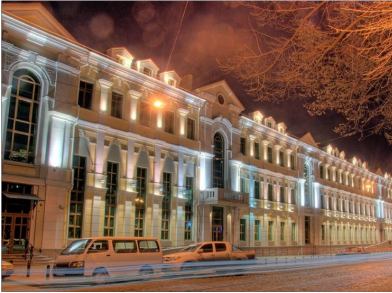
Рис. 2. 12 - Єврейський культурний центр «BEIT GRAND»