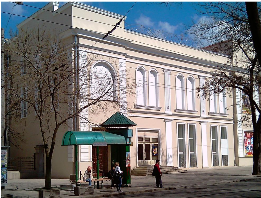
Рис. 2.17 - Одеський обласний театр ляльок

зарубіжжя. До літа 1941 р театр здійснив 10 постановок: «По щучому велінню», «Чарівна лампа Аладіна», «Казка про золоту рибку» та інші.