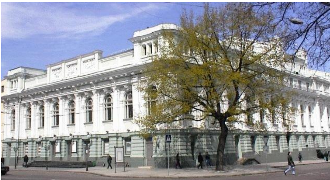
Рис. 2.8. - Одеський академічний український музично-драматичний театр імені В. Василька

Одеський український театр працює в історичній будівлі – пам'ятнику архітектури початку ХХ століття. Сама будівля театру — одна з найзнаменитіших пам'яток історії культурного життя міста, відомої як Театр Сибірякова.