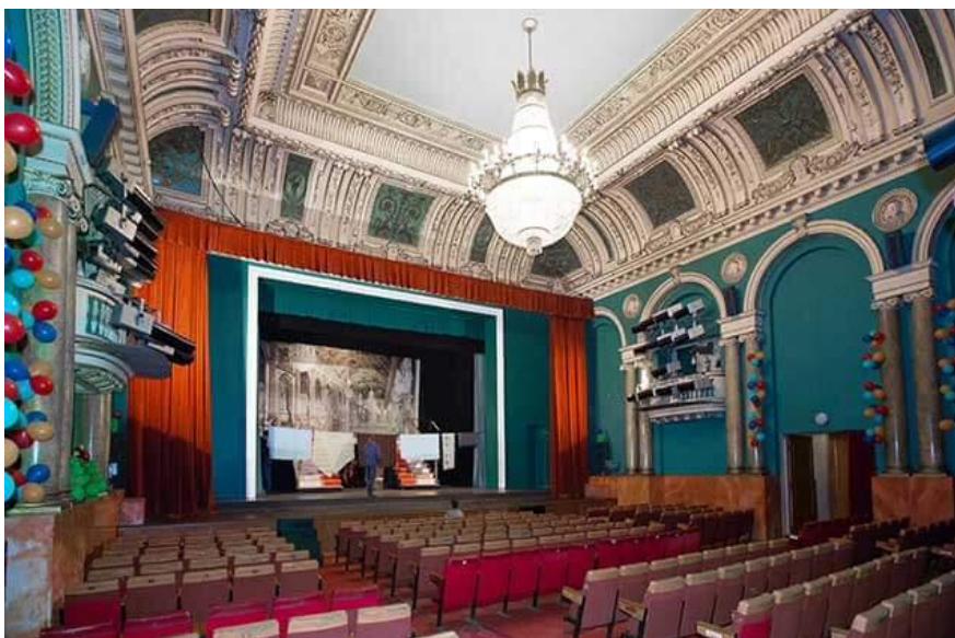
Рис. 2.11 - Одеський театр юного глядача ім. Юрія Олеші

Таким чином, програма, яка планомірно і послідовно втілюється в життя колективом, фактично відповідає концепції сімейного театру, де на кожного глядача чекають зустрічі з цікавими саме йому творами сцени [32].