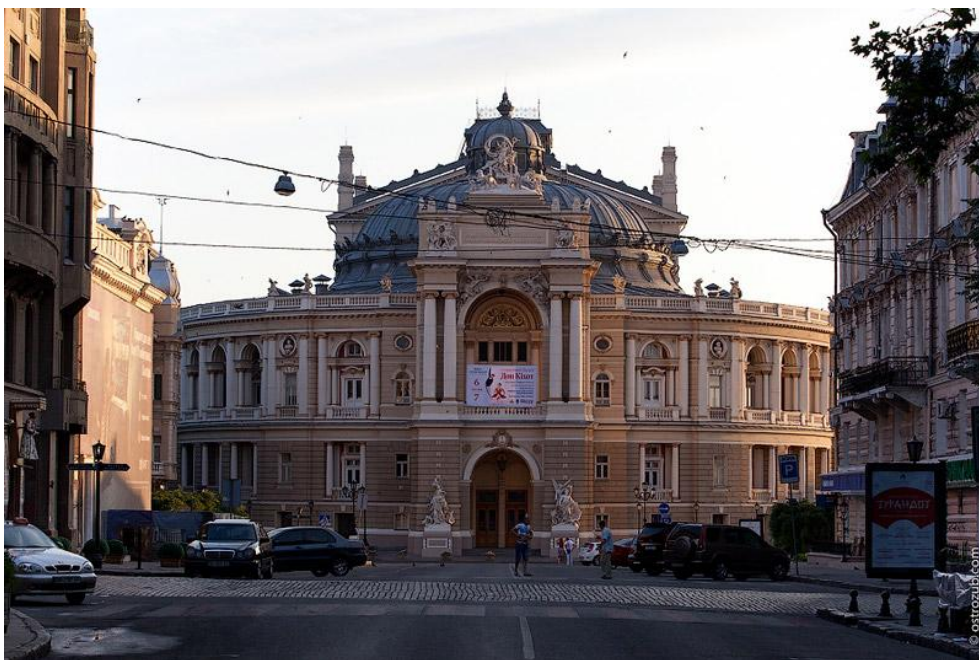
Рис. 2.5. - Одеський національний академічний театр опери і балету, м. Одеса

Герману Гельмеру. Вони були відомі своїми монументальними храмами в Дрездені, Будапешті та інших містах Європи. В результаті їхньої праці за рекордні три роки виріс новий театр.