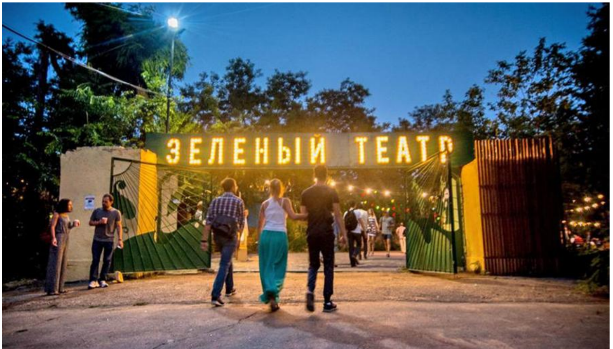
Рис. 2.14 – Зелений театр, м.Одеса

Фактично Зелений театр, крім спочатку закладених в нього чисто ідеологічних функцій формально «самодіяльної», «радянської», «народної», «інтернаціональної» творчості, широко пропагував, просував, рекламував як раз неформально професійні естрадні жанри, в першу чергу - джаз, конферанс , естрадну мініатюру, пантоміму, циркове мистецтво. І в цьому його безсумнівна заслуга в культурній історії міста. З часів поступового переміщення масових шоу на більш місткий стадіон ЧМП і одночасно облаштування камерних естрадних заходів на естраді в Міському саду, зірка цих підмостків потроху закотилася.