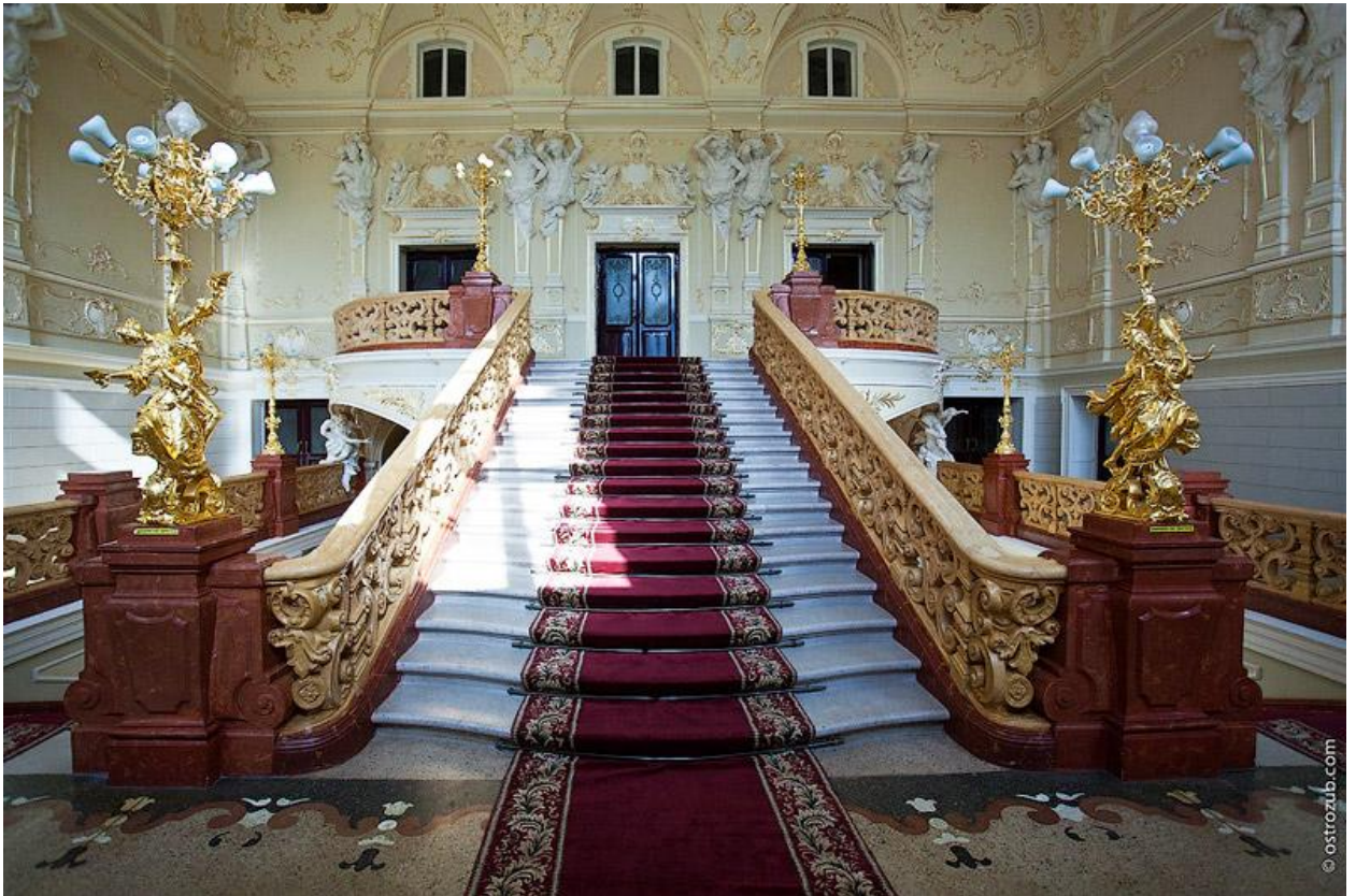
Рис. 2.7. - Одеський національний академічний театр опери і балету

Підковоподібна глядацька зала театру з галереями на 1635 місць. Серед лож виділяється «царська» ложа — в центрі бельєтажу просто навпроти сцени. Унікальна акустика приміщення дозволяє доносити навіть шепіт зі сцени до кожного глядача.