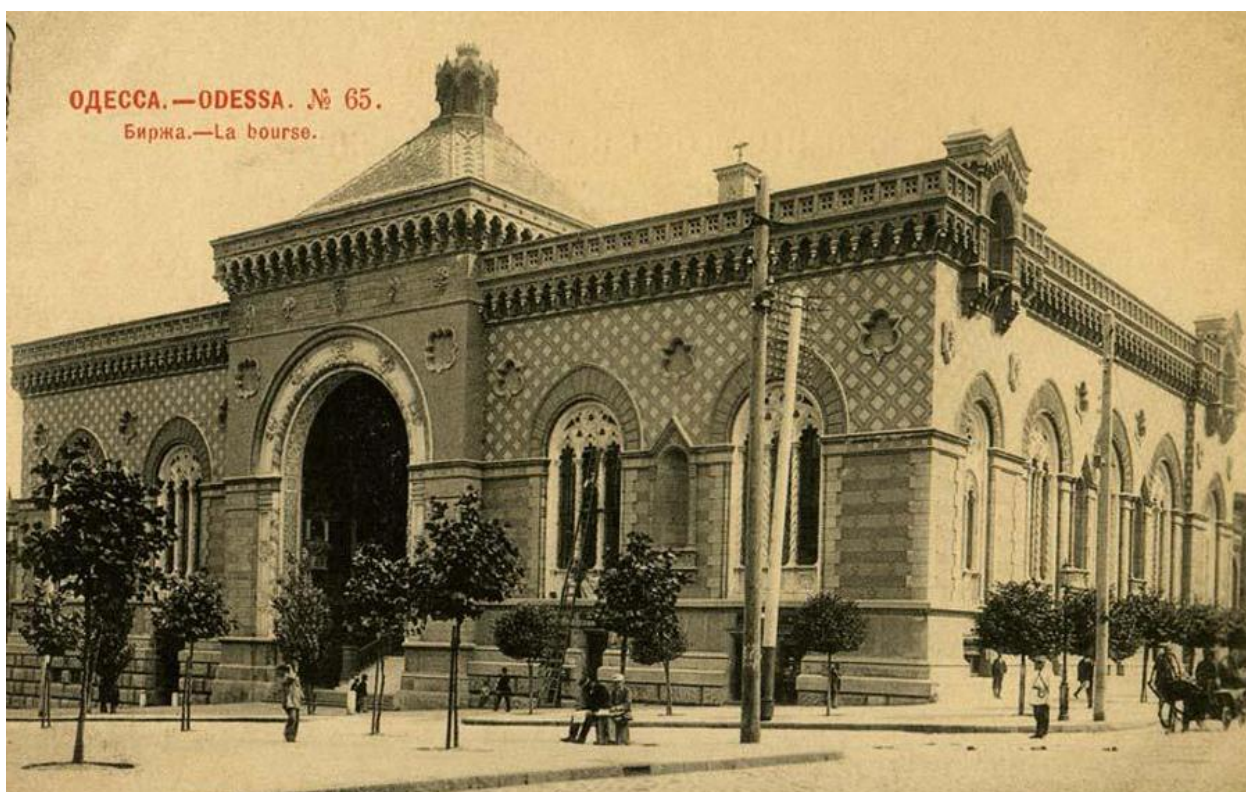
Рис. 2.13 – Історичне фото, Одеська обласна Філармонія