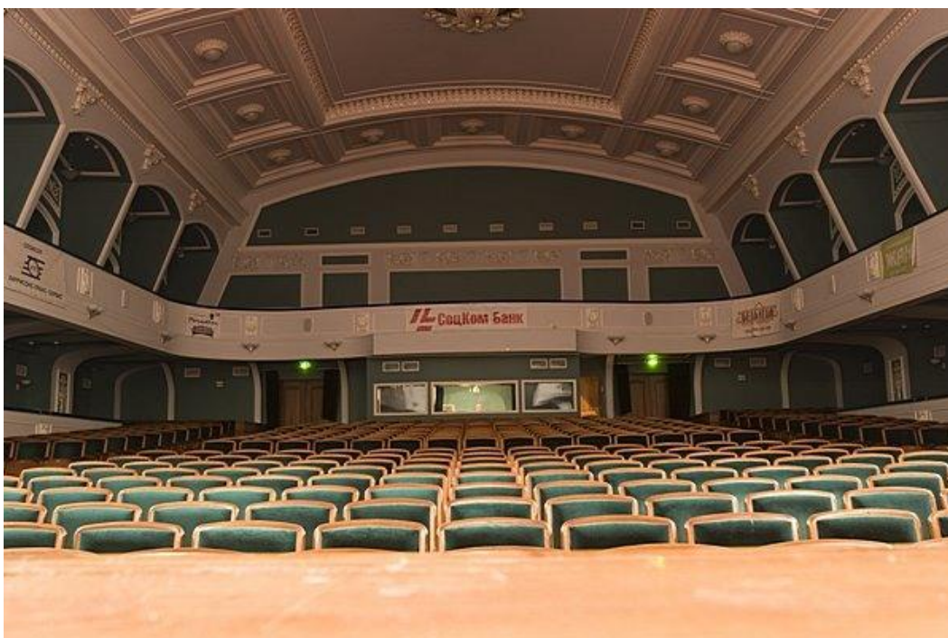
Рис. 2.9 – глядацька зала Одеський академічний український музично-драматичний театр імені В. Василька

Одеський український театр працює в історичній будівлі – пам'ятнику архітектури початку ХХ століття. Сама будівля театру — одна з найзнаменитіших пам'яток історії культурного життя міста, відомої як Театр Сибірякова.