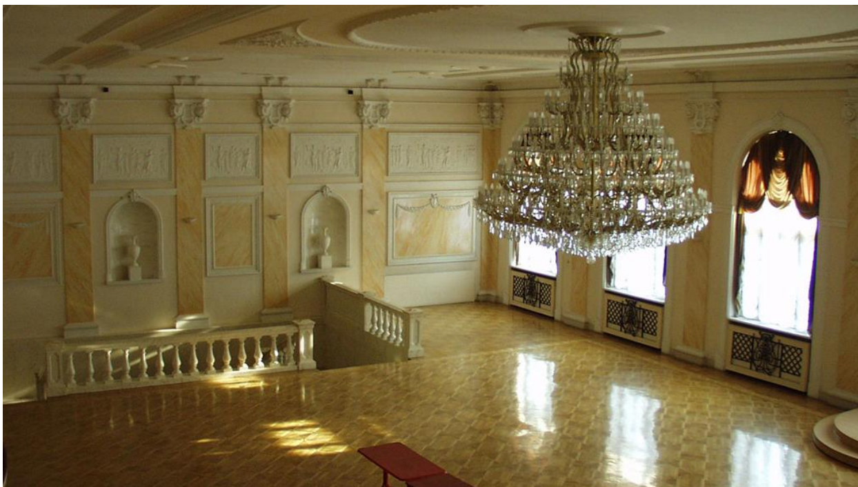
Рис. 2.10 - Одеський академічний український музично-драматичний театр імені В. Василька