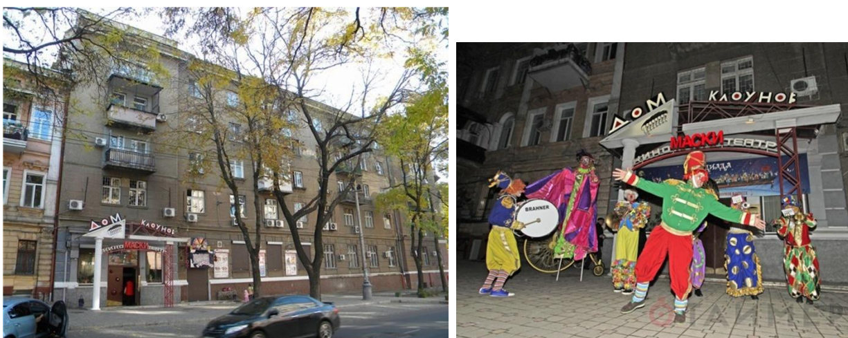
Рис. 2.18 - Театр «Будинок клоунів»