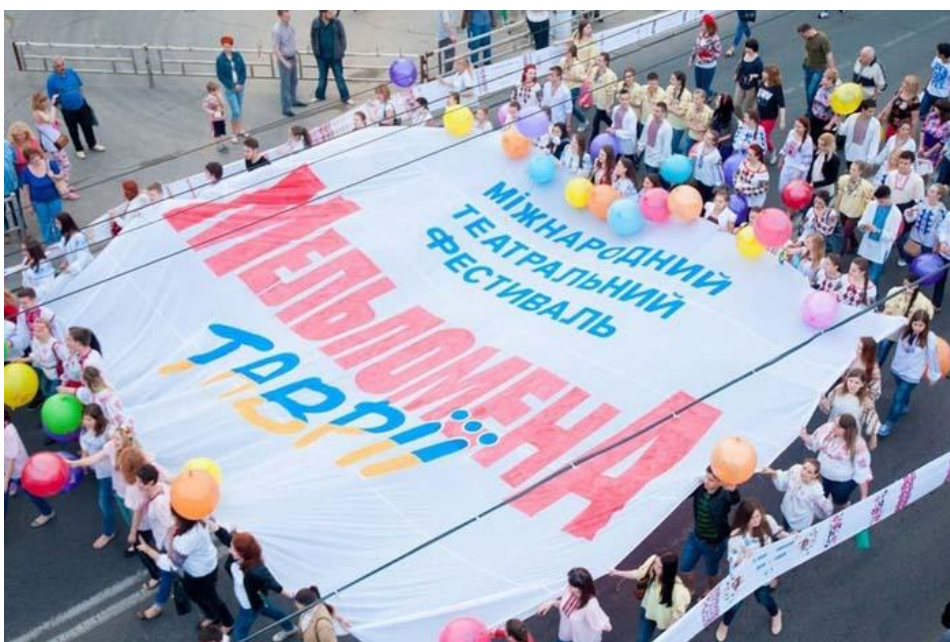
Рис. 2.3. – фестиваль «Мельпомена Таврії», м. Херсон

вже маємо від 20 театрів. Серед зарубіжних учасників -- театри з Угорщини, Туреччини, Грузії... Маємо надію, що у вересні ситуація з перетином кордонів у різних країнах зміниться на краще. Столичну театральну делегацію на «Мельпомені» представлятимуть Національний театр оперети (вистава «Москалиця» за твором Марії Матіос у постановці Влади Белозоренко) та столичний театр «Актор» («Вишневый сад» Антона Чехова у постановці Слави Жили). Українські театри, своєю чергою, також отримують пропозиції відвідати престижні європейські театральні фестивалі, але час вносить зміни у графіки та плани