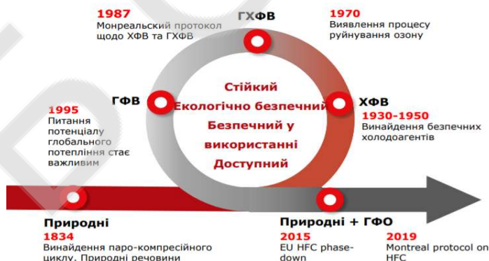
Мал. 2 Трансформація холодильних агентів

Збереженням клімату опікуються всі країни в залежності від своїх можливостей.