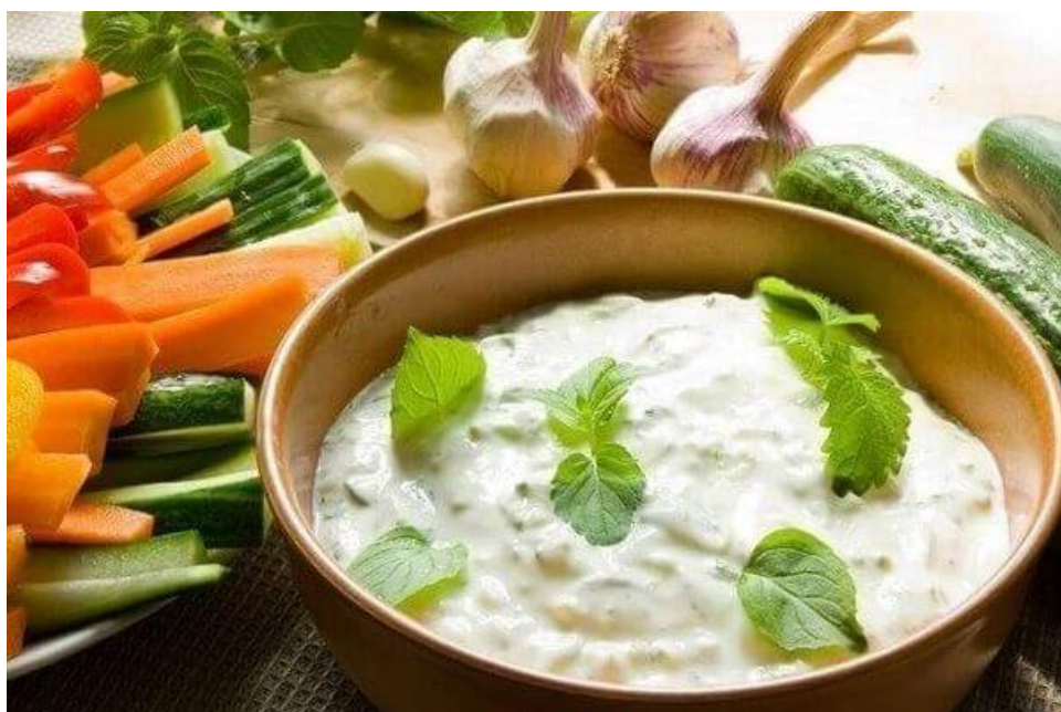
Рис. 2.1 Фото розробленого соусу

Умови та термін зберігання соусу – 48 годин при температурі 2...4 °С.