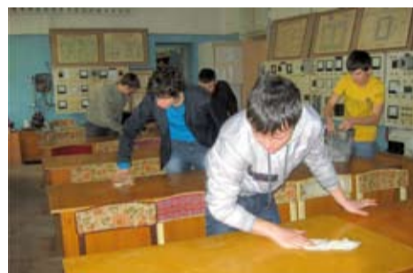
Студенти АКСІУП не стоять осторонь акції «Чиста академія»

З 21 березня до 22 квітня силами студентів було прибрано 88 аудиторій всіх корпусів академії. Відкрили акцію «Чиста Академія» факультети ТБХП та ЕМ, АКС та УП, а фінальну крапку поставили – М і М та Е і Б. Бути першими – не просто, проте студенти впорались зі своїм завданням і зробили крок до покращення свого життя, адже чистота і