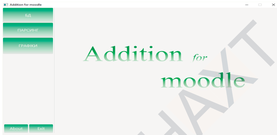
Рисунок 2. Головне вікно програмного додатку

При завантаженні програми з'являється головне вікно, що зображене на рисунку 2.