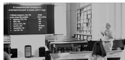
Рис.2. «Поновлювані джерела енергії». Лекція у Санкт-Петербурзькому політехнічному університеті