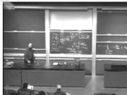
Рис.1. «Гравітація і супутники». Лекція в університеті Берклі (США).

Лекційні фрагменти другого типу (тривалість приблизно 10–15 хвилин) у більшості досить статичні. Але їх безумовною психологічною перевагою є те, що лектор звертається безпосередньо до глядача. Крім того, така форма дозволяє «будувати» відео-лекцію з окремих фрагментів, кожний з яких вичерпно освітлює окреме питання даної теми. Також очевидно, що 2D-відео-фрагменти не прийнятні як самостійний спосіб викладення матеріалу, але є корисною складовою лекції з фізики.