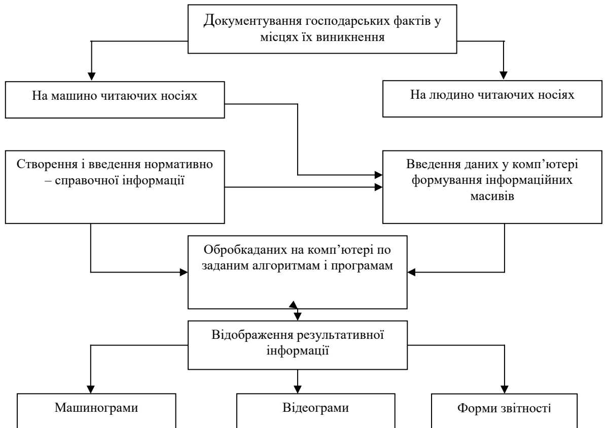
Рис. 3.1 – Схема автоматизованої форми ведення бухгалтерського обліку, яка використовується у ЗАТ «Одесакондитер»

Працівники відділу бухгалтерії застосовують для обробки інформації наступні програми: MSWord, MSExcel. У програмі MSWord в основному створюється і редагуються текстові документи та звіти. В цьому форматі працівники відділу отримують інформацію від інших підрозділів, керівництва та державних служб. У програмі MSExcel складаються різноманітні таблиці для подальших обчислень, дозволяє вирішувати завдання і тому є поширеною програмою в усіх підрозділах ЗАТ «Одесакондитер».