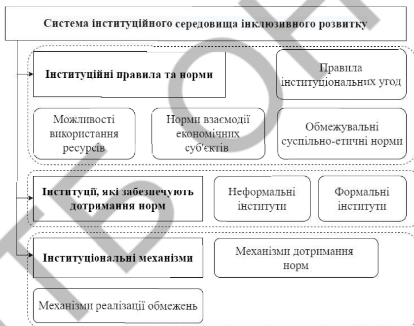
Рис. 1. – Система інституціонального середовища інклюзивного розвитку (авторська розробка)

Система інституціонального середовища може бути представлена (рис. 1) як сукупність інституціональних правил та норм, інституцій, які забезпечують дотримання правил та норм, та інституціональних механізмів дотримання норм та реалізації обмежень.