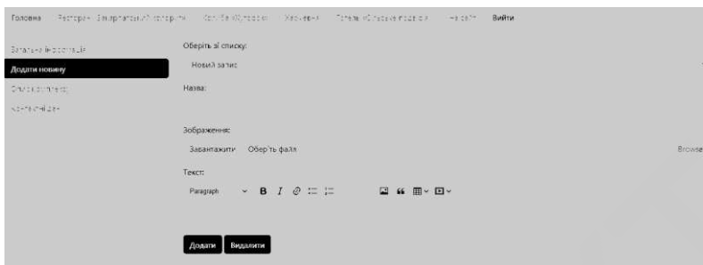
Рис. 2 – Додавання новин на панелі адміністрування

Таким чином, створений веб-сайт розширює можливості для підприємства і інформаційну доступність для майбутніх клієнтів.