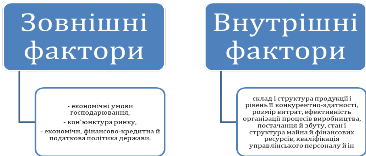
Рис. 1.1.1 Фактори фінансового стану підприємства (Сформовано автором на основі джерела: [1])