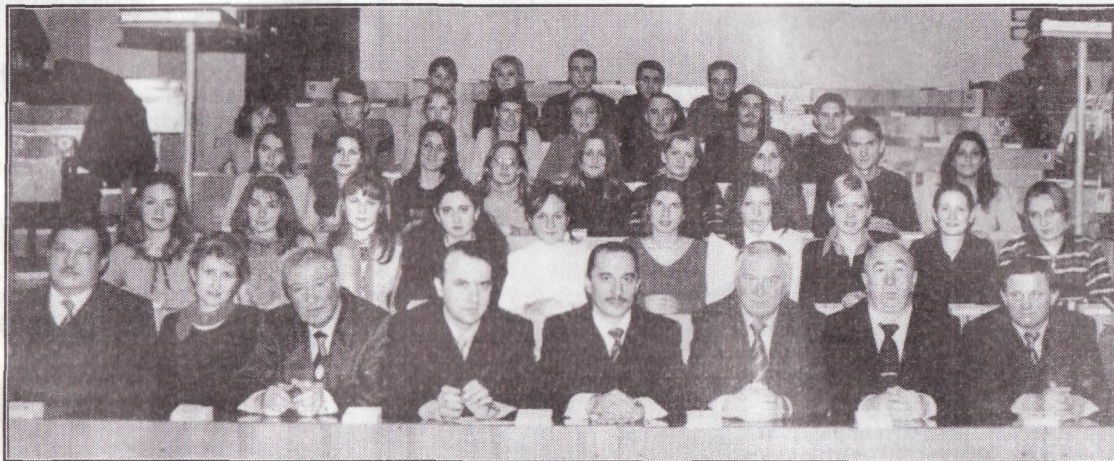
На снимке: студенты-отличники факультета с руководством академии.

На протяжении всего периода деятельности кафедры преподаватели активно проводят учебно-методическую работу. Ежегодно готовятся порядка 70 методических указаний, более половины из них ориентированы на использование