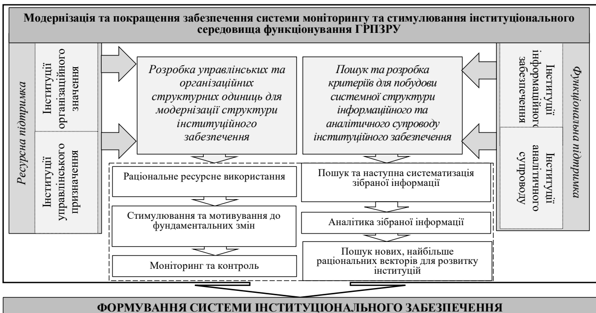
Рис. 1. Модель функціонально-ресурсного стимулювання та модернізації структури інституціонального забезпечення системи моніторингу та стимулювання середовища функціонування ГРПЗРУ

Для модернізації та покращення забезпечення системи моніторингу та стимулювання інституціонального середовища функціонування ГРПЗРУ запропонована структура інституціонального забезпечення функціонування та розвитку ГРПЗРУ, що являє собою “комплексну надбудову”, рис.1. Встановлено, що для максимізації ефективності зазначеної структури слід з одного боку забезпечити реалізацію постійних оновлень та змін, а з іншого боку саме інституціональне середовище є своєрідним джерелом постійних структурних змін.