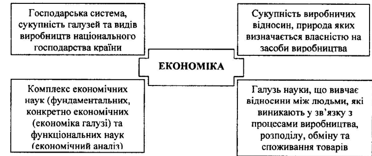
Рис. 2. Підходи до висвітлення категорії «Економіка»