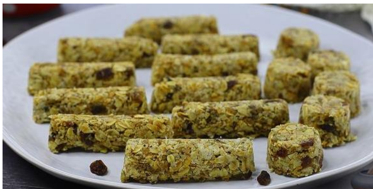
Рис. 2.5. Батончики з амарантом