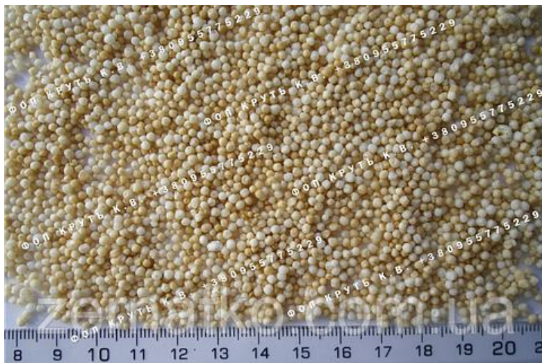
Рис. 2.2. Підірвані зерна амаранту

Таким чином отримують крихкі підірвані зерна, які гарно розжовуються, крім того білок амаранту краще перетравлюється та засвоюється. Така короточасна теплова обробка є ощадливою, адже цінні біологічноактивні речовини зберігаються в насінні амаранту. Із підірваними насіннями амаранту готували батончики.