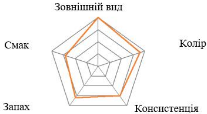
Рис. 2.3. Профілограма батончиків з амарантом