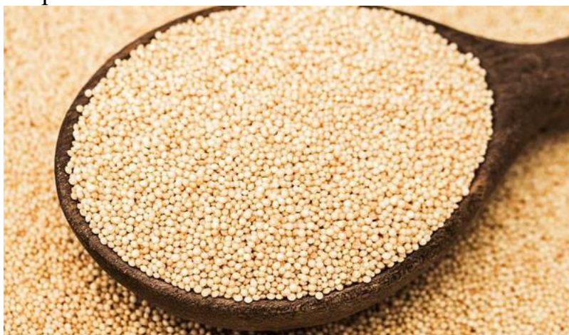
Рис. 2.1. Зерно амаранту

Зерно амаранту — чудове джерело вітаміну А, який не дуже страждає при обробці. Ще вони корисні з таких причин: