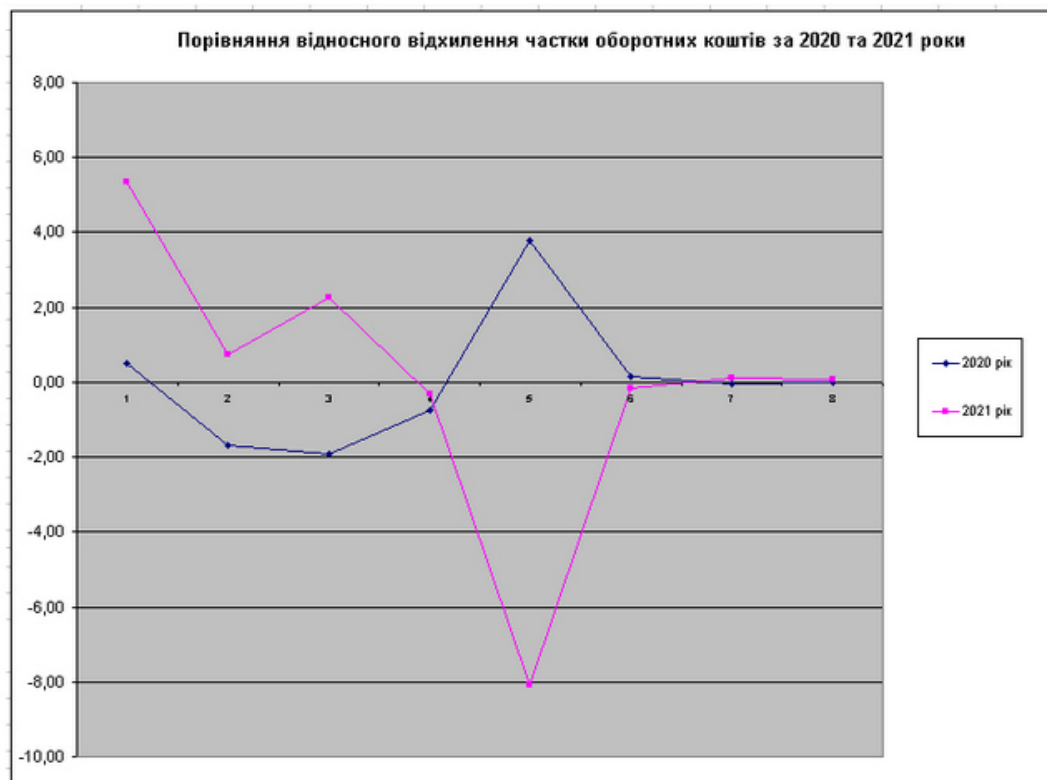
Рисунок 2.1. Порівняння відхилення частки оборотних коштів.

Також, для більш наглядної оцінки змін оборотних коштів ми побудували наступну діаграму, завдяки котрій ми бачимо, що якщо за період 2020 року частка дебіторської заборгованості збільшилася на 3,79%, то за 2021 рік вона різко знизилася на 8,09%. При цьому в 2021 році значно зросла частка виробничих запасів (+5,34%) та готової продукції (+2,28%).