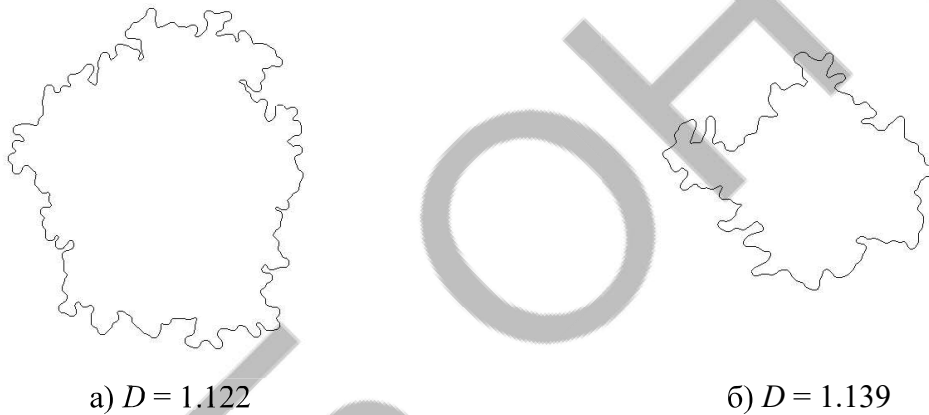
Fig. 4. The boundaries of structural formations Fig. 3 a), b)

Comparison of estimates of the fractal dimensions of cluster boundaries, obtained during the formation of nanosized carbon films by the PVD method (Fig. 2) and the results of computer simulation, showed the coincidence of their values (Fig. 4), taking into account the measurement accuracy. This can serve as a criterion for the adequacy of the developed computer model and the actual physical process of deposition using PVD technology.