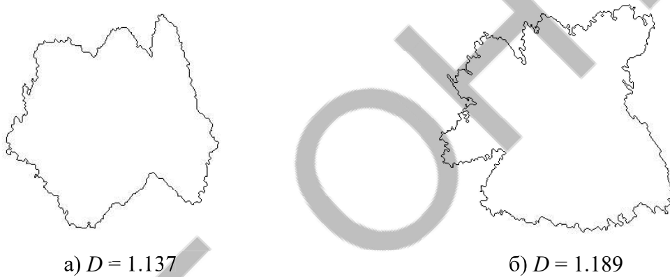
Fig. 2. The boundaries of structural formations Fig. 1 a), b)

After heating the sample and reaching a certain vapor pressure of the working substance, the supply of a positive potential to the anode leads to the appearance of a non-self-sustained discharge and the formation of plasma.