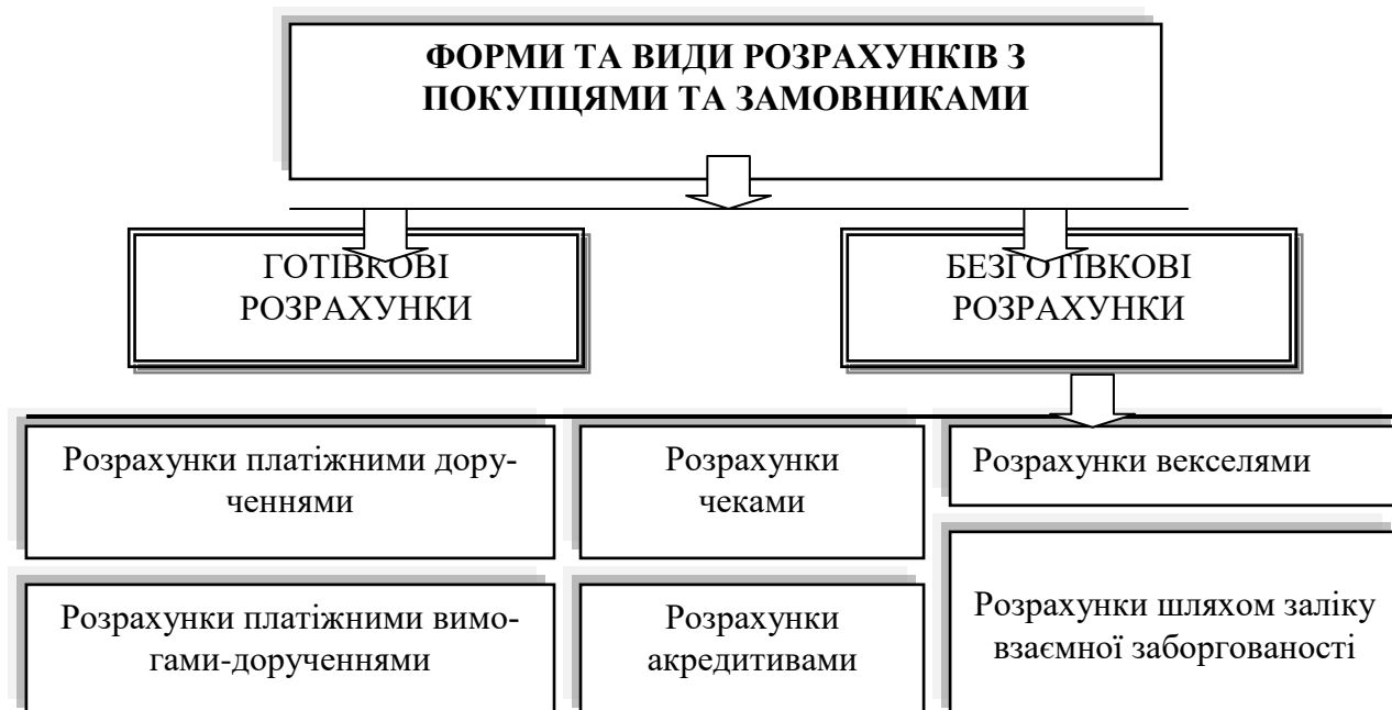
Рис.1.1. Форми і види розрахунків з покупцями і замовниками [13]

Господарські суб'єкти мають здійснювати переважну більшість платежів із банківських рахунків у безготівковій формі.