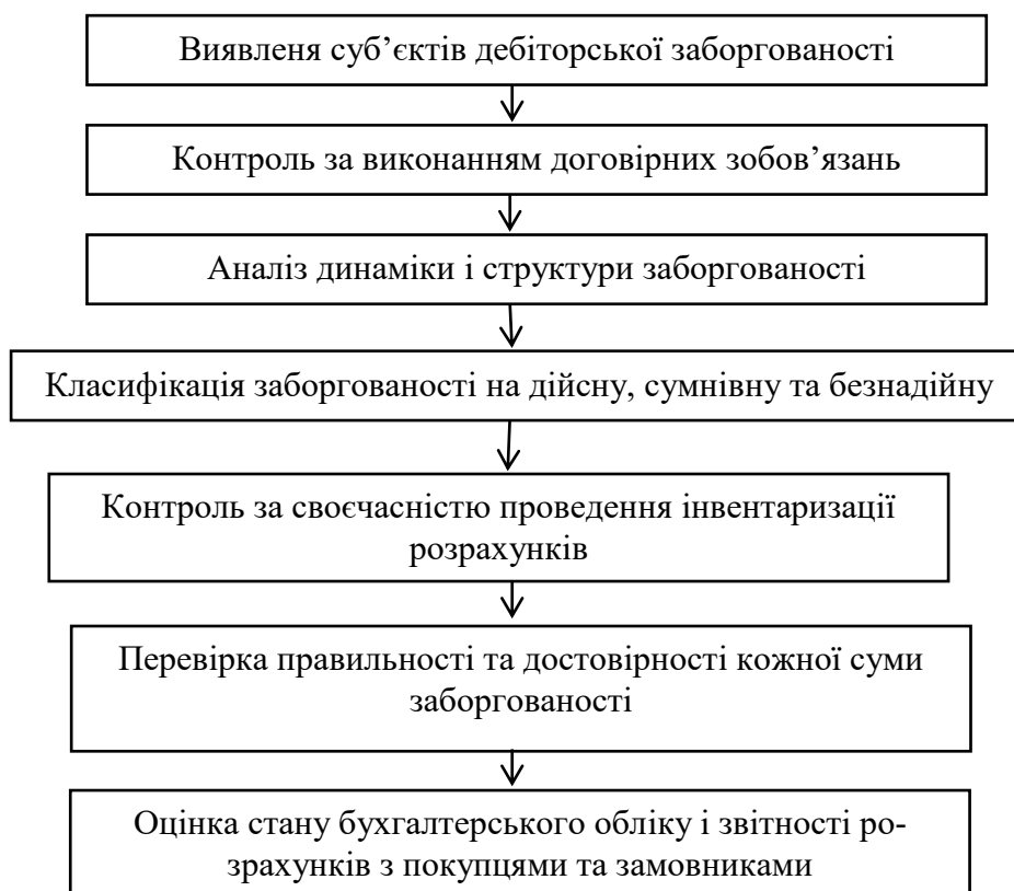
Рис. 1.4. Послідовність проведення контролю розрахунків за товарними операціями

Контроль розрахунків з покупцями та замовниками доцільно розпочинати з контролю за виконанням договірних зобов'язань. Укладений між сторонами договір є основою для проведення розрахунків. Господарський договір складається у формі єдиного документа, який підписується сторонами та скріплюється печатками. При укладанні господарського договору сторони мають чітко узгоджувати всі необхідні умови, що включають предмет, ціну та строк дії договору.