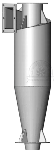
Рис 2.1 – Циклон ЦН-15

Заходи спрямовані на запобігання, відвернення, уникнення, зменшення, усунення значного негативного впливу шумового забруднення: