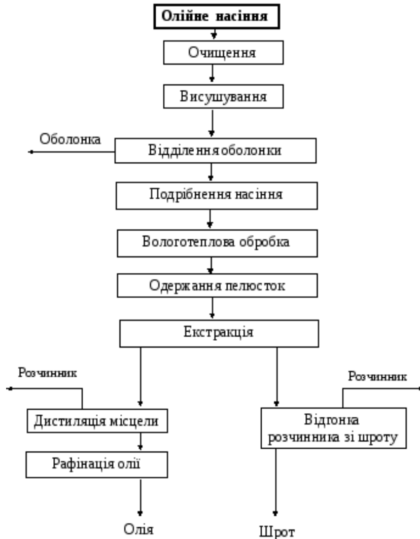
Рис. 1.2 – Технологія виготовлення олії

Перевій з насіннерушок, транспортований скрибковим конвеєром та норією, буде подаватися у гвинтовий конвеєр, а звідти в насінневійки. Ядро з насінневіялок буде передаватися гвинтовим конвеєром через норію на аспіраційні насінневіялки, а потім знову на гвинтовий конвеєр. Ядро з конвеєру буде потрапляти у норію через магнітний сепаратор та потім в гвинтовий конвеєр, проходячи через вальцеві станки. М'ятка, отримана після валкових станків, буде подаватися на скребковий конвеєр через магнітний сепаратор і потім у пресовий цех. М'ятка із пресів буде направлятися в семичанні жаровні, де чани будуть обігріватися парою.